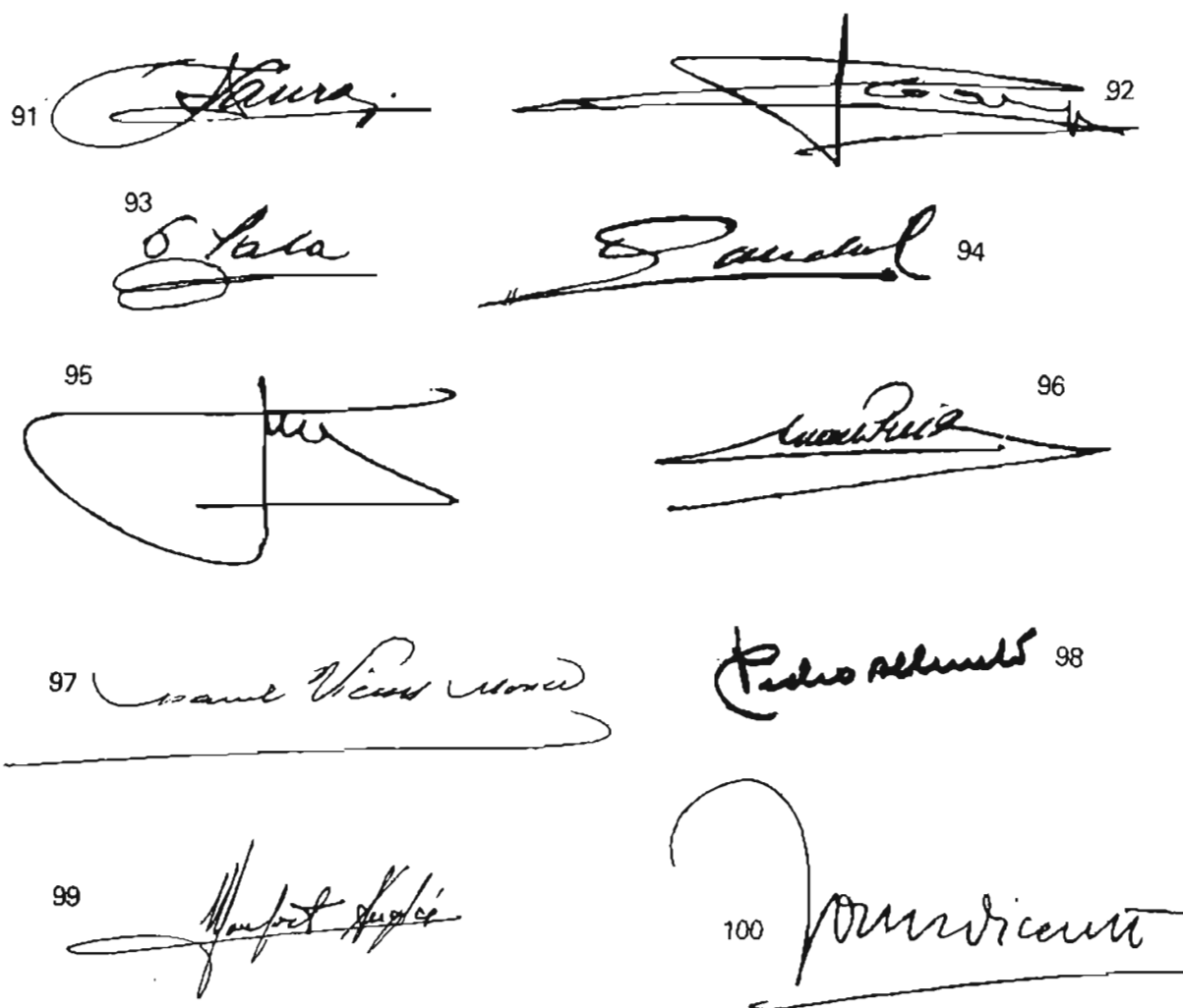
Signatures autògrafes de les primeres autoritats municipals guixolenques (1935-1984).

por el Excmo. Sr. Ministro de la Gobernación». Del 21-VIII-1973 al 18-IV-1979 (17-44).