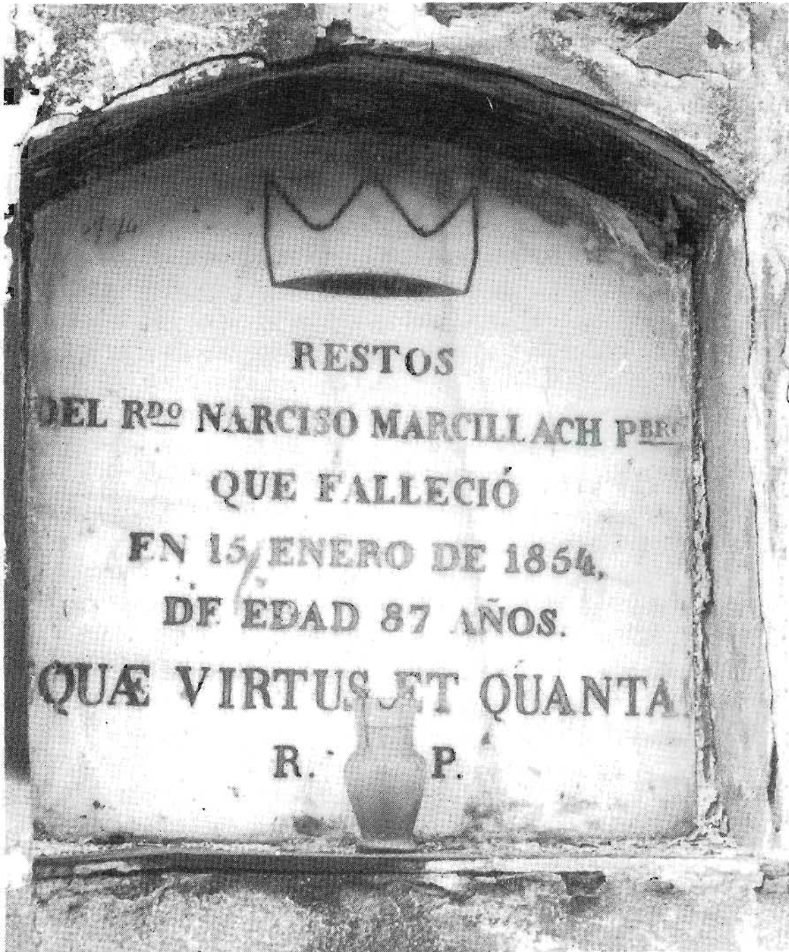
Làpida que tapa el nínxol on reposen les restes de mossèn Narcís Marcillach, ecònom que fou de la parròquia guixolencs en moments ben difícils.

–Servesca provisionalment, que luego vindrá la autorització del Sr. Bisbe».