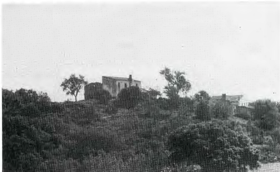
1. Vista general de l'ermita de Sant Daniel de Calonge.

Pel cantó de l'evangeli, a mitja nau, s'accedeix a la petita sagristia, en un racó de l'emblancat de la qual, hi ha, sobre una fornícula rectangular, la data 1814.