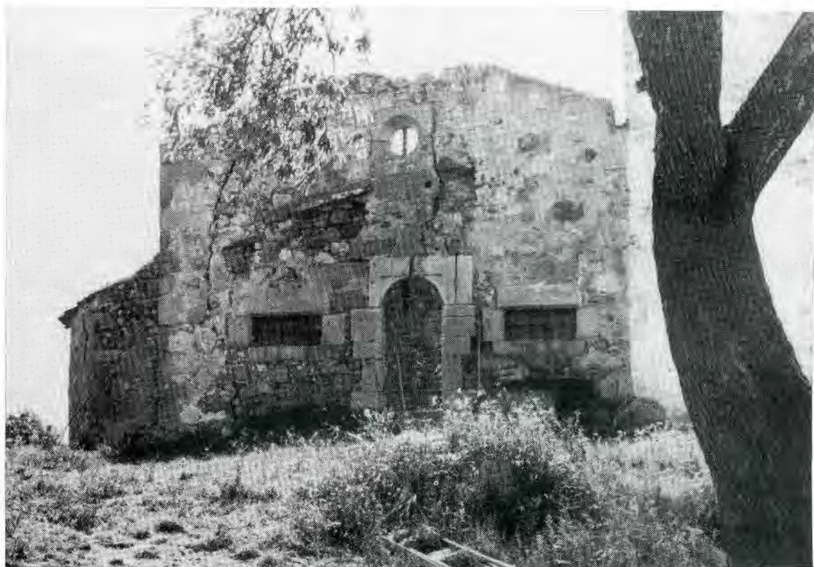
2. Façana de l'ermita.

Sabem del cert que a l'església parroquial de Sant Martí de Calonge existia el benefici diaconil de Sant Daniel, que havia estat fundat per la Universitat o Comú de la vila el 21 de maig del 1514 (11) . I a la visita pastoral del bisbe Guillem Ramon de Boïl, del 1532, ja s'esmenta un altar dedicat a Sant Daniel (12) .