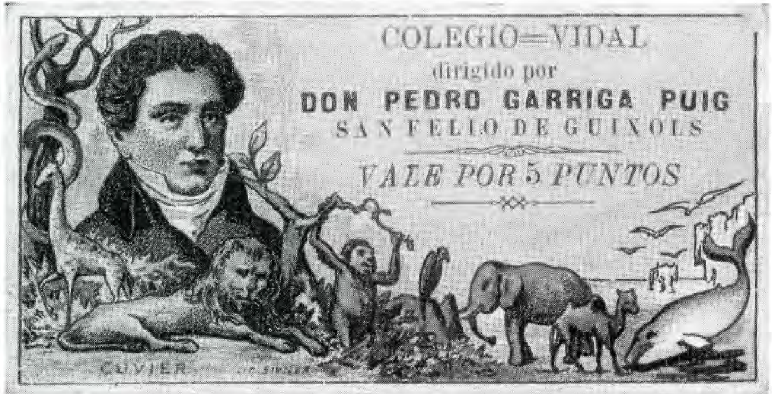
Anvers d'un cromo-val del Col·legi Vidal. El personatge ací reproduït és Cuvier.

Per a estímulo dels estudiants, Garriga practicà un sistema de vals tipus cromo força suggestius, dedicats a personatges cèlebres de tot temps, que alhora devien servir per a la qualificació escolar de l'alumne. (1).