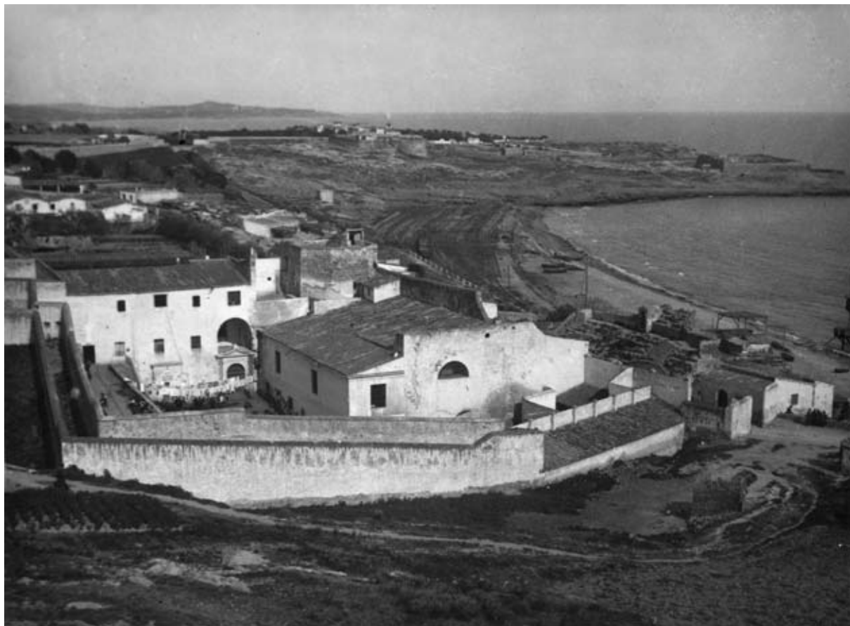
Església de Santa Maria del Miracle ha- bilitada com a presó. Vista exterior, 1905. Autor: desconegut. Arxiu Històric de la Ciutat de Tarragona (AHCT).