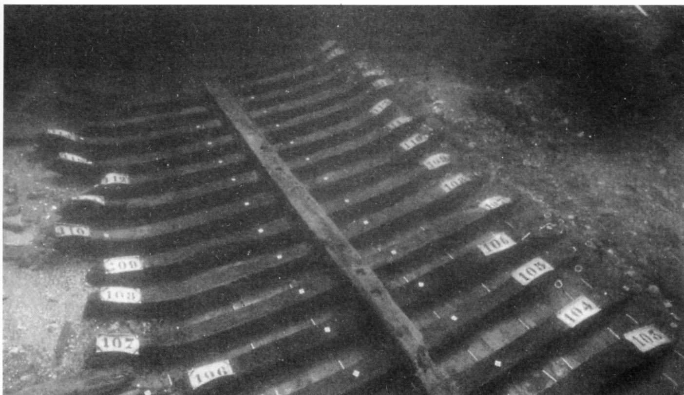
El vaixell medieval Culip IV durant els treballs d'excavació duts a terme pel C.A.S.C. (Centre d'Arqueologia Subaquàtica de Catalunya)