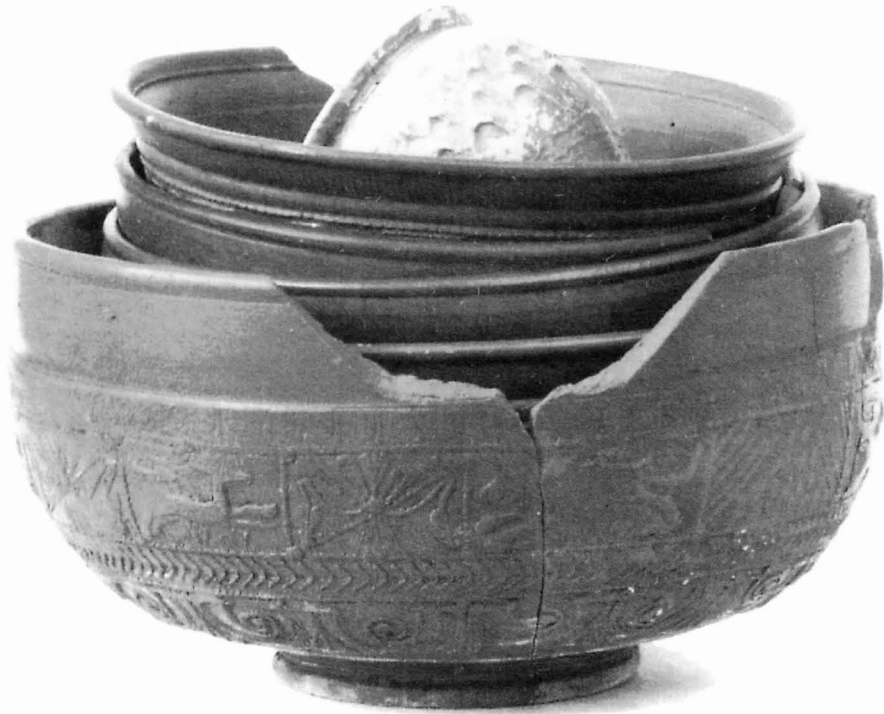
Pila de vasos ceràmics, tal com van aparèixer durant l'excavació del derelictu Culip IV

Els resultats principals de l'estudi es poden resumir com segueix: