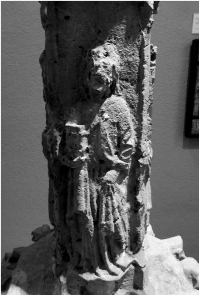
Llibre i raigs de sol a la mà. Sant Valentí