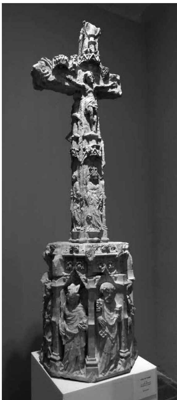
La part de la creu que es conserva al Museu Comarcal de Manresa

La Creu de la Culla és una de les creus de terme més antigues de Manresa que porta una marca literària: la poesia que va escriure Verdaguer. És una creu de pedra d'estil gòtic que es troba en un punt per on antigament passava el camí ral de Manresa a Barcelona, entre l'Hospital de Sant Joan de Déu i la Culla, una masia fortificada que depenia de la pabordia de la Seu manresana. El nom Culla, documentat ja l'any 1009 com a lloc on hi havia una vinya, prové del mot llatí cucllu que ha passat a ser cogoll, cogulló, cogul i vol dir lloc elevat. Durant el segle XVI la Culla va ser una de les masies més riques de Manresa. El segle XIX va ser una important explotació vinícola fins que quedà afectada de fil·loxera.