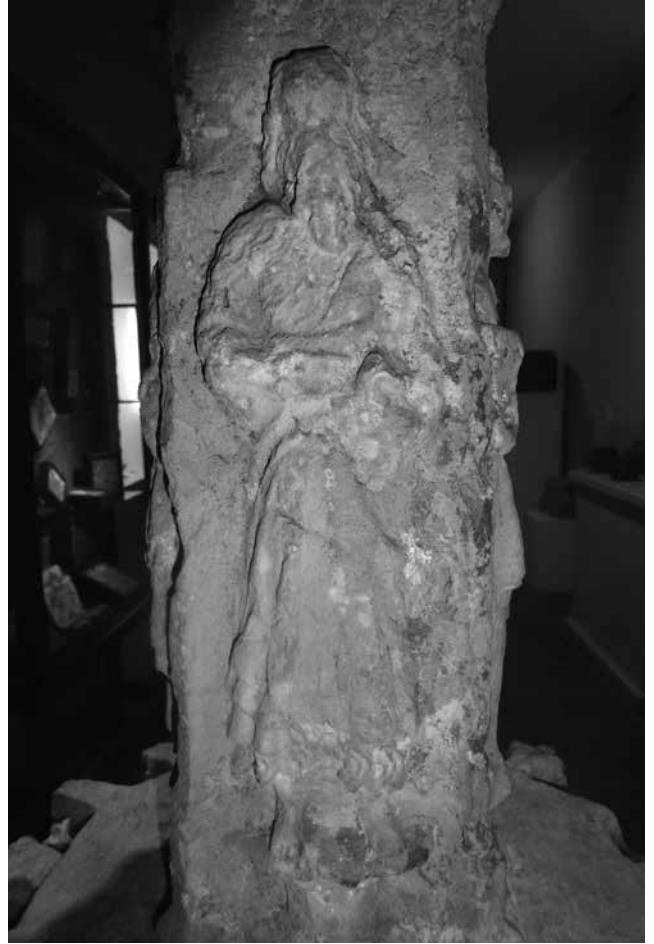
Sant Pau, ermità

L'any 1880 s'hi va establir, uns pocs anys, una petita comunitat de frares caputxins provinents de Ceret, expulsats de França. A finals de segle passà a ser propietat de la família Pelfort i de llavors ençà va ser habitada per masovers fins a 1950. Va viure uns anys d'abandonament i finalment, ofegada per la pressió urbanística, l'Ajuntament de Manresa la va comprar i la va rehabilitar l'any 1982. Avui convertida en Camp d'Aprenentatge del Bages és la seu de la Denominació d'Origen Bages.