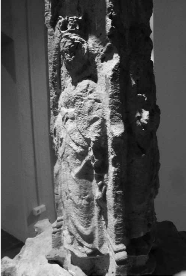
Palma, corona i roda del martiri de santa Caterina