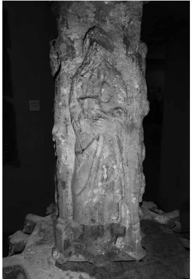
Sant Bartomeu: un llibre o una màscara

santa Eulàlia, patrona de Barcelona; santa Agnès, patrona de Manresa i de les mestresses de la Culla; i, per fi, en una de les cares principals de la creu, com hem dit, la Verge sentada, a l'igual que es veu en l'escut del cabildo de la Seu" 2