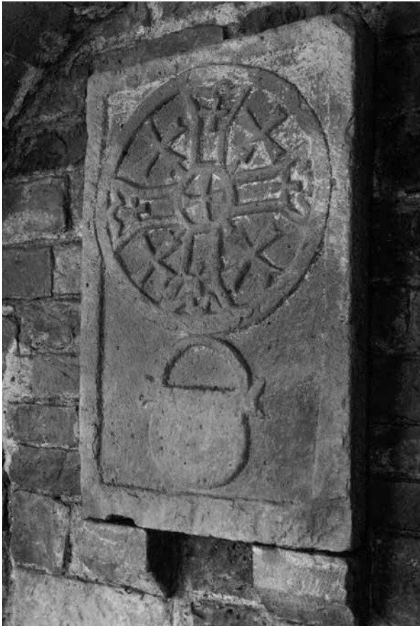
3. Llosa-cernotafi de la família Calders