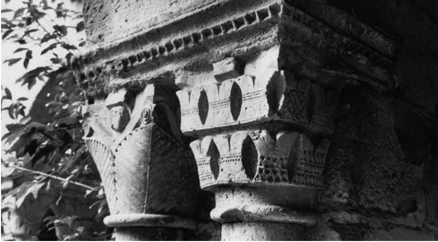
5. Capitell amb els rocs heràldics dels Rocafort