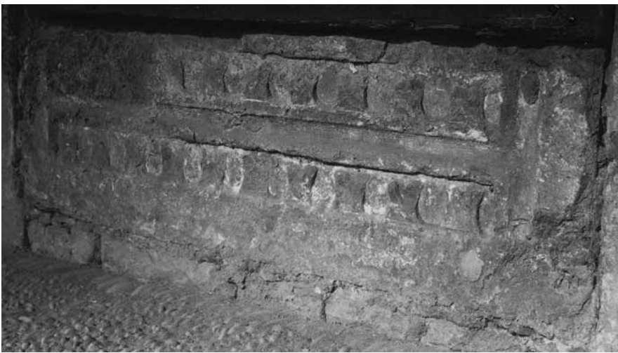
6. Sepultura dels Rocafort

creu gran que en du altres al mig i als braços i, a sota, la caldera heràldica de la família (fig. 3). Aquesta llosa podria ser de temps de Guillem II de Calders, mort el 1208, o de Guillem III, que va fer una donació al monestir a l'any el 1229, perquè el senyal encara no és dins cap escut, com es va fer més endavant amb els senyals de blasó.