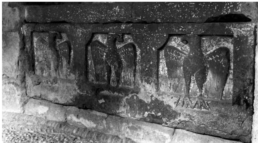
7. Possible sepultura dels Aguiló

Si l'ala del claustre on hi ha el capitell és de ben entrat el segle XIII, la sepultura o, almenys, les seves lloses constituents, són anteriors, coetànies amb la dels Calders de la galeria ponentina, perquè els senyals també són protoheràldics, de finals del XII, per la qual cosa el sarcòfag podria correspon-