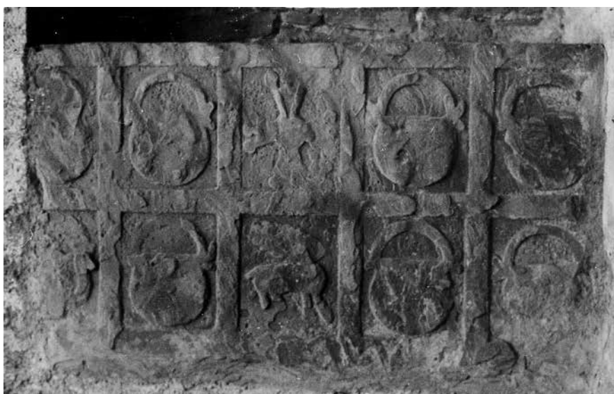
2. Llosa sepulcral dels Calders

Aprofundim en les obres patrocini de famílies de la noblesa de la comarca com els Calders, els Boixadors i els Rocafort, després d'haver parlat anteriorment de les obres finançades pels Talamanca, totes elles en el marc del monestir de Sant Benet.