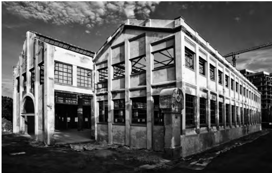
Museu d'història de Barcelona a la fàbrica Oliva Artés.

El Poblenou era el districte manufacturer que va ser l'àrea d'expansió industrial de Barcelona del segle XVIII al XX. L'equipament es troba dins del Parc Central del Poblenou, l'antiga àrea suburbial molt dinàmica en els darrers segles, que va acollir els prats d'indianes al segle XVIII i va formar el major districte industrial de Barcelona des de mitjans del segle XIX a mitjans