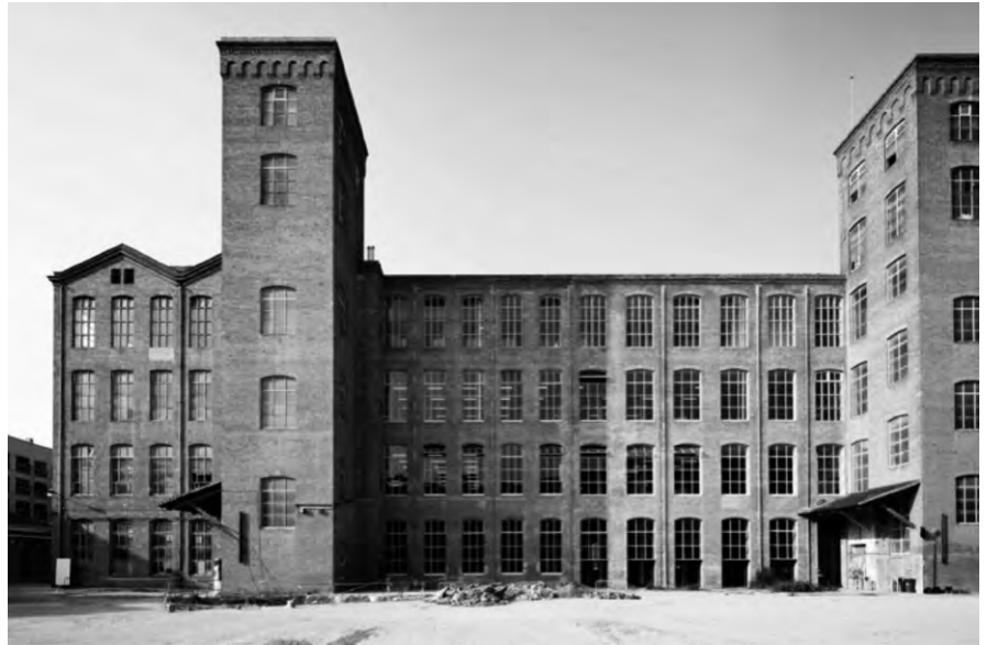
Fàbrica de Creació.

El procés de rehabilitació de l'edifici s'ha portat a terme d'una manera atípica. A partir del 2008, amb la reconversió en Fàbrica de Creació Artística, s'inicia l'activitat regular de la Fabra i Coats com a equipament destinat, fonamentalment, a oferir espais i recursos al servei dels creadors de la ciutat de Barcelona. La posada en funcionament provisional d'aquest espai va formar part del seu disseny futur. Després d'un condicionament bàsic d'una quarta part de la superfície total de l'equipament i paral·lel a l'ocupació de l'espai, es van definir un primer pla d'usos i la concepció d'un avantprojecte arquitectònic que permetés poder abordar la rehabilita-