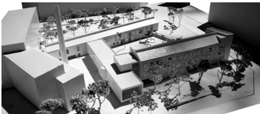
Can Framis funciona com a Museu de Pintura Contemporània, inaugurat a Barcelona l'abril de 2009.

El projecte va consistir en la restauració dels dos edificis de les fàbriques actuals i la construcció d'un nou que unirà els altres dos, coincidint