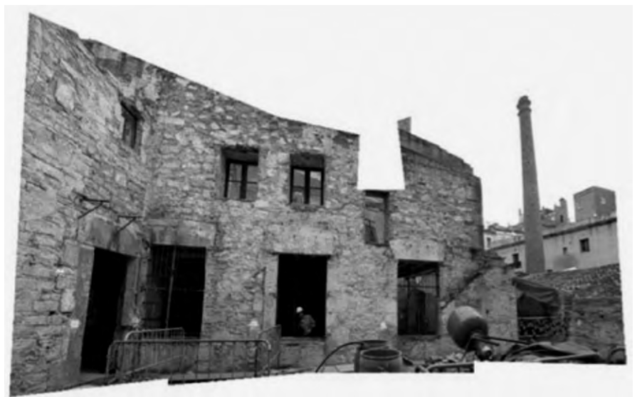
Rehabilitació de "La Seca" com a espai escènic.

Se l'anomena "La Seca" en memòria de la Seca Reial o Reial Fàbrica de Moneda de la Corona d'Aragó i hauríem de buscar l'origen de la paraula "seca" en el mot àrab sekka , com a "lloc on es fabrica moneda". A la fàbrica es va encunyar moneda entre el 1441 i el 1849, tot i que una part de l'edifici dataria del segle XIII o, fins i tot, d'algun segle anterior. La fàbrica ha estat objecte de múltiples transformacions, destacant les del segle XVIII, amb la col·locació de l'escut de la casa reial borbònica a la façana principal; la del segle XIX, amb diverses remuntes executades i la modificació dels forjats; o la de prin-