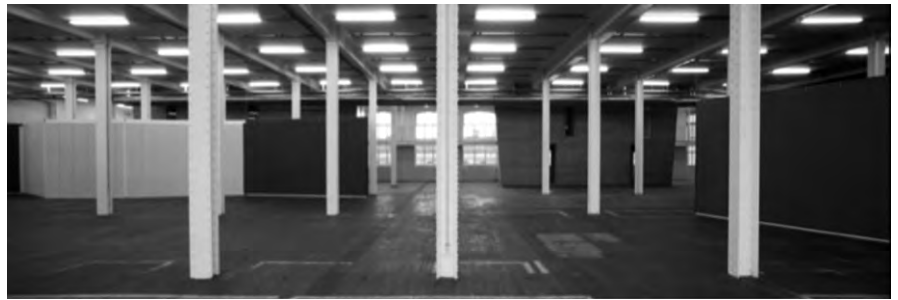
Interior de la nau.

ció definitiva de l'espai a curt termini. Aquest procés va funcionar com a banc de proves.