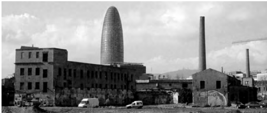
Part del complex industrial.

Als segles XVIII-XIX, els terrenys agrícoles que se situaven al nord de Barcelona van ser objecte d'un gran canvi a causa de la revolució industrial. A l'antic barri del Poble Nou es trobava el motor productiu de la ciutat i hi convivien múltiples recintes industrials. Va arribar a ser tan important la zona industrial que era anomenada popularment com la "Manchester catalana". A finals del s. XVIII, el complex propietat de la família Framis va dedicar la seva activitat a la indústria de la llana. El complex industrial de Can Framis va ser un dels primers a instal·lar-se ocupant, aleshores, la superfície equivalent a quatre illes de l'Eixample i estava format per diversos edificis. Anys després, quan es va traçar la trama Cerdà, el complex Framis va passar a una cota inferior, a causa de la nova rasant d'aquest pla, i quedà enfonsat i esbiaixat respecte dels seus carrers adjacents. Al cap dels anys, va anar perdent la seva activitat i va passar a l'oblit. A diferència d'altres fàbriques, protegides pel Catàleg Patrimonial de la ciutat de Barcelona, a Can Framis no es va valorar cap interès arquitectònic, ja que es va projectar pensant més en la seva funcionalitat que no pas en els aspectes estètics. Això va passar amb gran part de les indústries del Poble Nou que tenien construccions