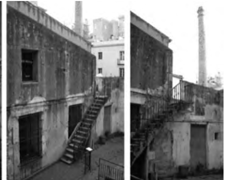
L'estat original presentava un estat d'abandonament molt important, amb múltiples patologies estructurals.