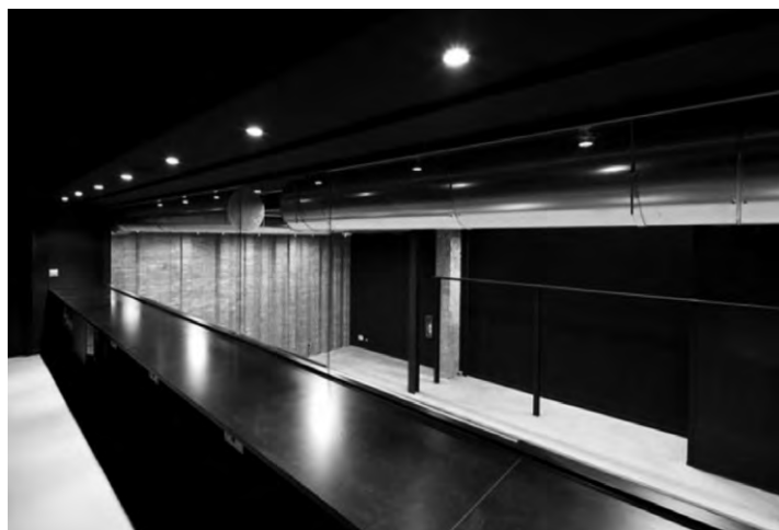
Estat final de l'edifici amb les façanes rehabilitades amb recuperació d'elements constructius originals.