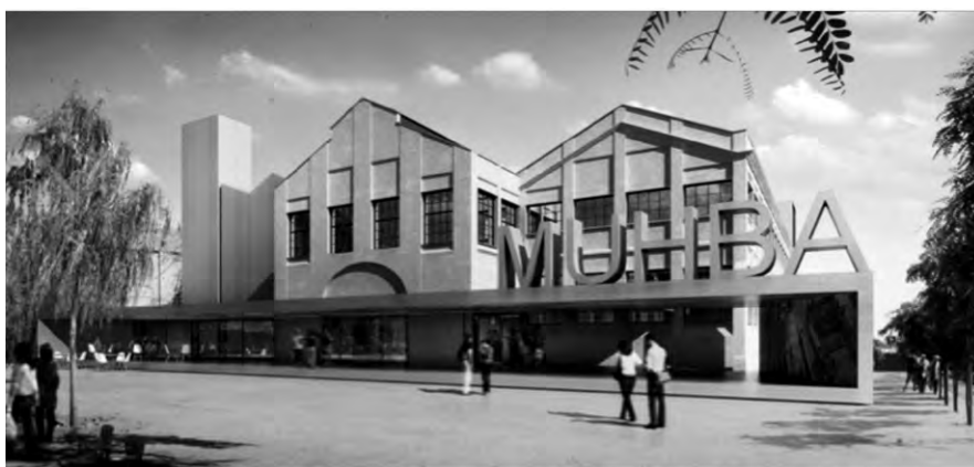
Museu d'història de Barcelona a la fàbrica Oliva Artés.

ren un accés nou pel Carrer d'Espronceda. Tot i la recessió de la postguerra, l'empresa va recuperar amb el nom de Tallers Oliva Artés, l'any 1940, i disposava d'un segon taller construït al sector nord-oest de la parcel·la, cap a la prolongació de el carrer Ali Bei (ara carrer del Marroc). El taller va patir successives obres de reformes posteriors i ampliacions condicionades per la disponibilitat de solar, fins que, durant els anys 60, l'empresa va iniciar una crisi que acabaria amb la suspensió de pagaments, al 1978. Després va continuar com a cooperativa constituïda per antics treballadors (TOACSI, Tallers Oliva Artés Societat Cooperativa Industrial), fins al tancament definitiu, al 2000.