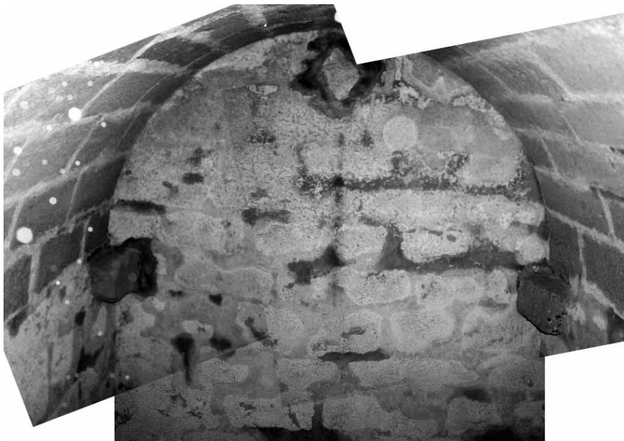
Fotomuntatge de la cisterna de l'edifici gòtic.

Ramon Soler de la Plana, des del moment que la seva mare renuncià a l'usdefruit dels béns familiars, comença a dilapidar frenèticament el seu patrimoni, venent i arrendant diverses propietats i contraient els primers deutes, contra els quals obliga el seu potent patrimoni. Una espiral negativa que conclourà amb la dilapidació del patrimoni rendista dels Soler de la Plana, inclòs el seu casal de la Plana de l'Om. Cap a finals dels anys 40 sembla que Ramon Soler comença a establir relacions amb l'illa de Mallorca on acabarà establint la seva residència. L'any 1856 Ramon Soler casa el seu fill Joaquim amb Maria Anna Noguera Pizà i Gabucio, filla d'una família de nobles mallorquins.