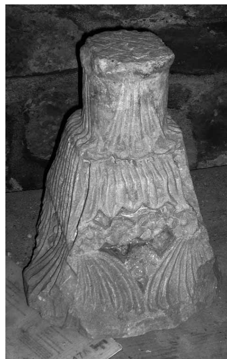
Capitell gòtic troncocònic que va aparèixer durant els treballs de restauració de l'edifici