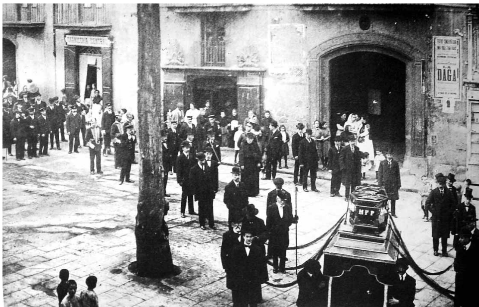
Fotografia d'un enterrament de principis del segle XX a la Plana de l'Om on es pot observar el gran portal de tipologia barroca de la casa Seitó (avui enderrocada) i a l'esquerra de la fotografia la carnisseria Central ja formant part de Cal Soler de la Plana.

La Plana de l'Om, que es trobava fora del primer recinte murat de la ciutat 2 , es convertiria durant la baixa edat mitjana, en un dels principals centres de residència per part de les classes benestants de la Manresa gòtica. El casal gòtic que va aparèixer integrat en l'actual edifici de la Plana de l'Om, és un dels pocs exemples d'edificació gòtica civil que conservem a la ciutat, però si es rehabilités amb cura, segur que apareixerien altres restes d'aquest brillant període de la nostra ciutat. La família que va fer construir aquest casal gòtic de la Plana, de moment, ens és desconeguda, però si que hem pogut esbrinar coses de la família Soler de la Plana, que va construir el casal barroc uns segles més tard. Després de la forta crisi econòmica del segle XV, durant els mal anomenats segles de "decadència", es va anar consolidant un nou ordre social al nostre país, sustentat en el progrés econòmic i social de les classes me-