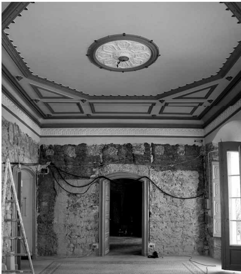
Interior dels treballs de restauració de la sala noble de l'edifici.