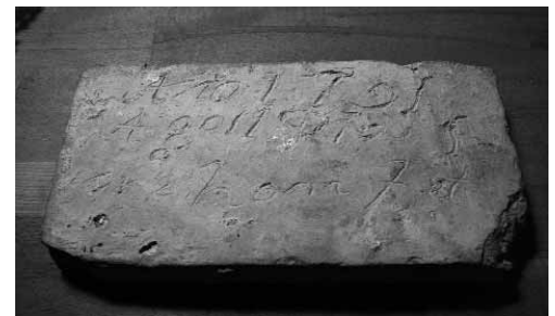
Maó localitzat en els treballs de restauració a la cúpula de la llanterna que porta inscrita la data 1791.

L'edifici barroc segueix tenint una planta més o menys trapezoidal molt descompensada, amb l'ala oest molt inclinada degut a que s'adaptava a un edifici conegut com la casa Seitó , que va ser enderrocat en obrir-se el carrer Alfons XII. La transformació del casal en el període barroc afectava la totalitat de l'edifici, però en gran mesura incorporava la planta i bona part de les parets mestres de l'edifici medieval. El pati interior va ser ampliat i cobert per una llanterna, reforma que nosaltres re-