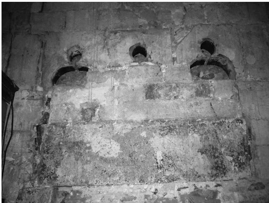
Finestra coronella de tres àmbits amb arcs trilobats tapiada que donava al pati gòtic de l'edifici.