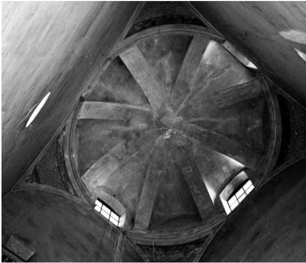
Estat de la cúpula abans de la seva restauració on s'aprecien les esquerdes i les restes de la decoració de l'any 1897.