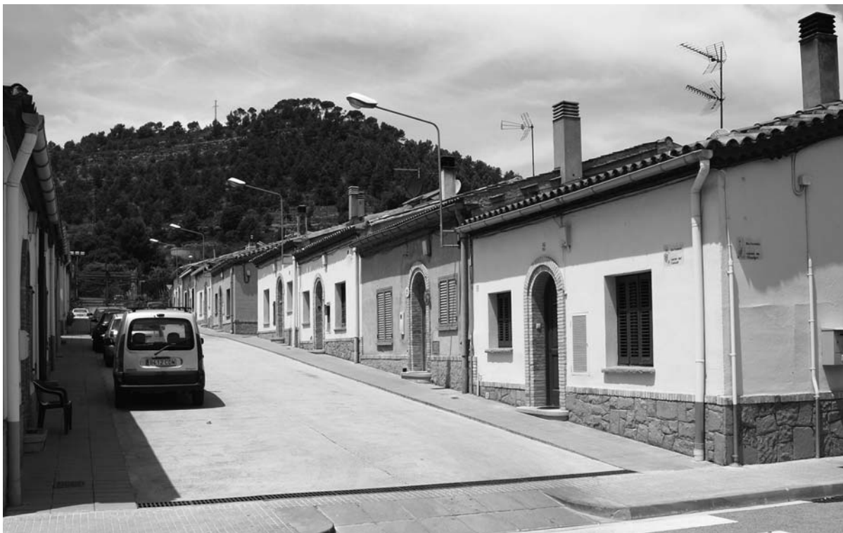
Un dels carrers d'habitatges de cases barates.

arcs rebaixats de les finestres amb el mateix material. D'aquesta manera, les diverses ampliacions de l'edifici no es distingeixen exteriorment.