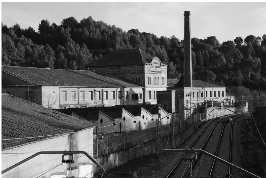
Conjunt fabril vist des del pont de la via.