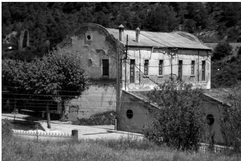
Edifici de la botiga.

Els habitatges de la colònia estan situats a l'oest del conjunt, a l'altre costat de la carretera C-55 i a uns 200 m de la fàbrica. Es tracta d'un conjunt d'habitatges d'estil anglès amb planta baixa i pati construïdes entre 1945 i 1952 i dos blocs d'habitatges de planta baixa i tres pisos, un dels quals es va rehabilitar el 2001 i l'altre es va enderrocar i s'ha construït de nou el 2007 amb el mateix espai edificable. Hi ha un total de 80 cases en 10 grups de 8. Presenten façana al carrer i tenen un pati al darrera. Són de 81 m 2 i el pati de 69. A la façana hi ha una porta central amb arc de mig punt i els brancals remarcats en maó i dues finestres amb persiana de llibret. La coberta és a dues vessants. Les cases eren obra de l'arquitecte Sala, que treballava normalment per a la família Villà. El conjunt de la urbanització ha estat arranjat, els carrers asfaltats i s'ha habilitat una zona d'ús comú amb un parc