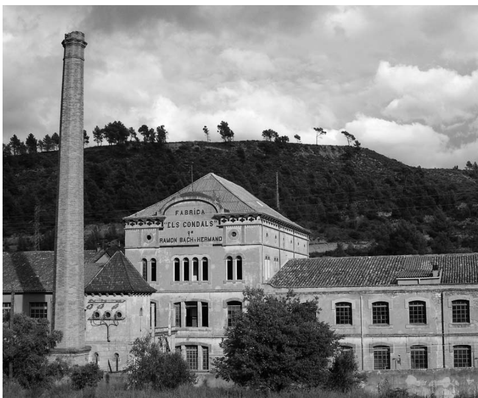
Vista frontal del conjunt fabril.

Els Comtals tanquen l'eix industrial del Cardener en el terme de Manresa i combinen una característica arquitectura industrial amb un paisatge rural típic del Bages, amb vinya, horta i bosc de ribera. La importància patrimonial d'aquest eix industrial, desenvolupat al