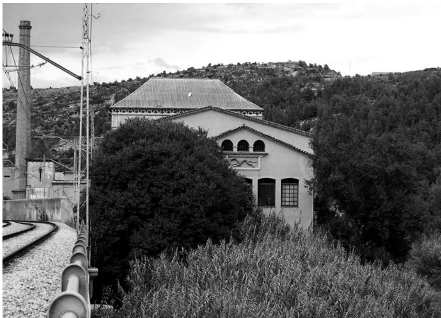
Vista de l'ala sud amb la marca del llebrer.

L'estil del conjunt industrial es pot qualificar com d'arquitectura industrial academicista i es tracta d'un complex d'edificacions industrials de diverses èpoques: s'inicia l'any 1861 amb la primera fàbrica unificada, s'amplia el 1918 amb la fàbrica nova i es completa a partir de 1942 amb les darreres ampliacions i unes naus de planta baixa.