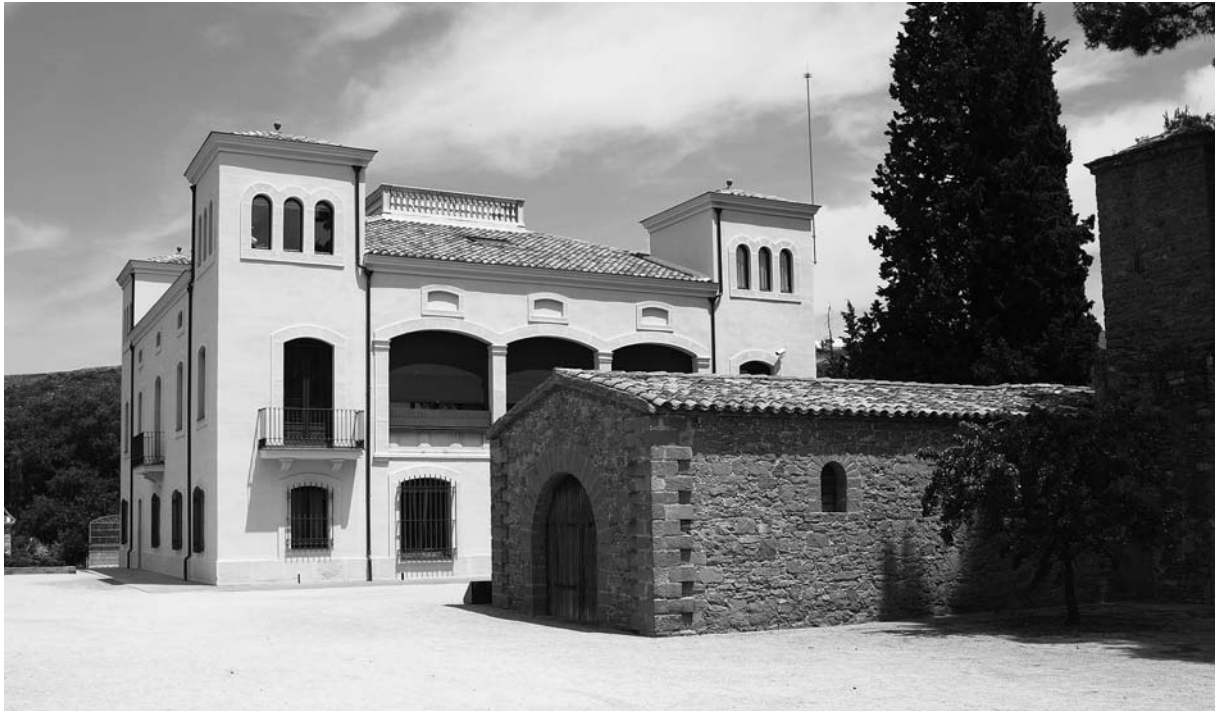
Torre de l'amo i capella. (foto: Lluís Virós)

cinte i la via del tren hi ha una nau llarga de planta baixa que servia de moll de càrrega cobert per a vagons de tren. Al seu costat i a la dreta de la porta d'entrada al tancat del conjunt fabril hi ha l'edifici de la porteria on el porter registrava les bosses del personal que sortia de la fàbrica.