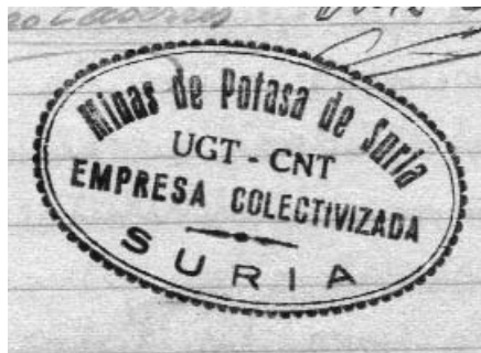
Segell de MPS, empresa col·lectivitzada.

El famós Decret de Col·lectivitzacions de 24 d'octubre de 1936 (DOGC, núm. 302, de 28 d'octubre) establia en el seu article segon que seran obligatòriament col·lectivitzades totes les empreses industrials i comercials que el dia 30 de juny del 1936 ocupaven més de cent assalariats i també aquelles que, tot i ocupar una xifra inferior d'obers, els patrons hagin estat declarats facciosos o hagin abandonat l'empresa. En l'article 9è es deia que en les empreses en què hi hagin interessos de súbdits estrangers, els Consells d'Empresa o els Comitès Obrers de Control, en ca-