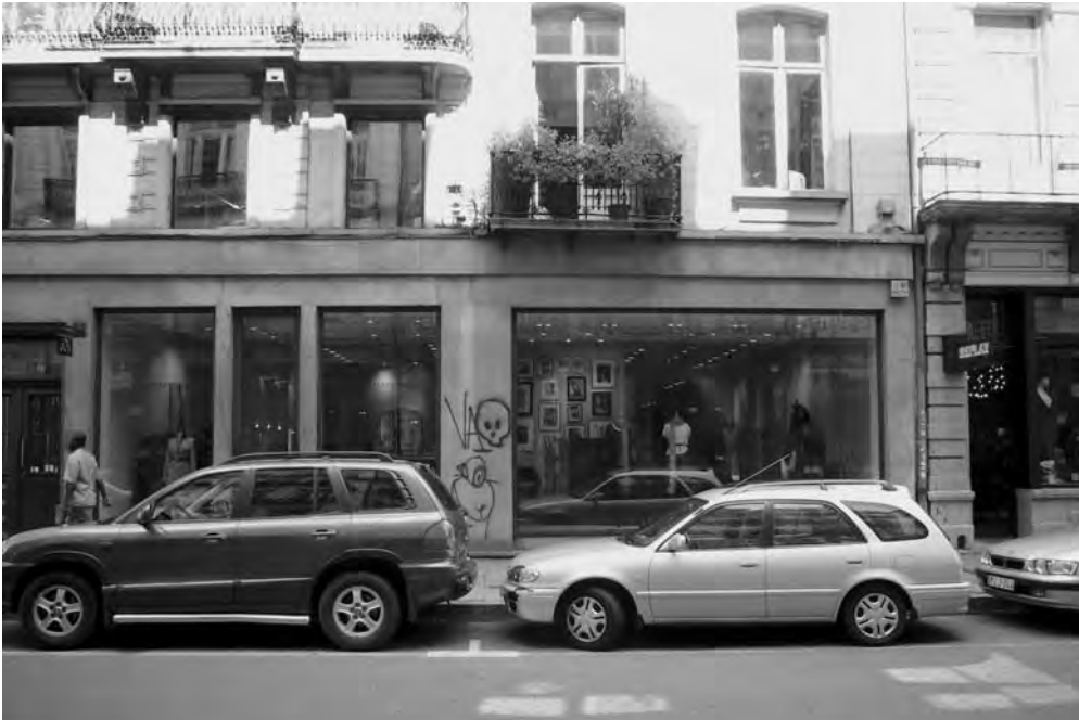
2. Edifici de la "Maison Jorba" a la rue d'Antonie Dansaert (Dansaertstraat).