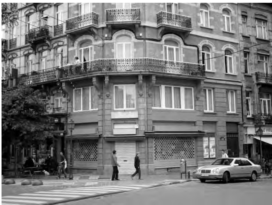
8. Edifici actual de la rue de Moscou (Moscoustraat) cantonada place du Parvis amb un altre local de negoci dedicat també a la venda de roba.