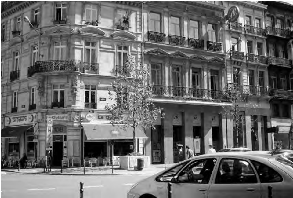
5. Edifici actual on hauria estat situada la segona sucursal de la "Maison Jorba" a Brussel·les.