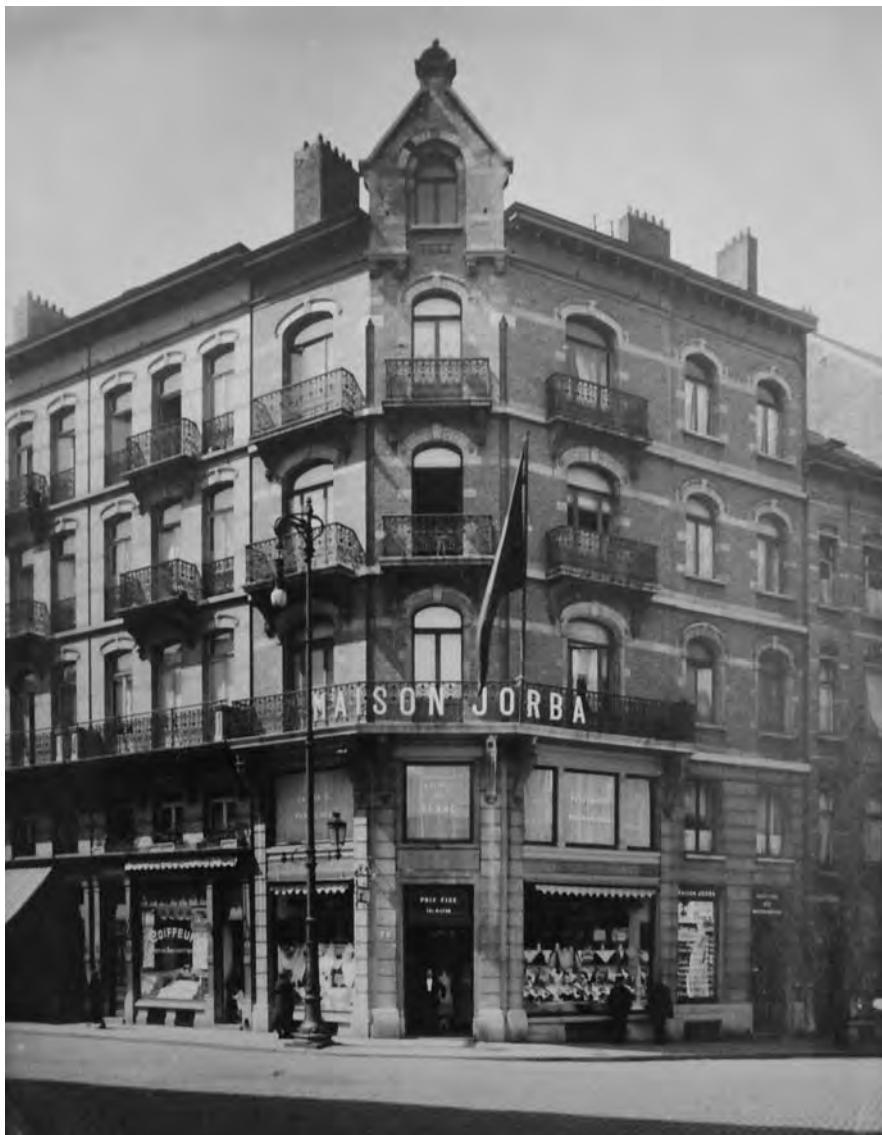
7. Sucursal de la “Maison Jorba” situada al barri de Saint Gilles, al carrer de Moscou (Moscoustraat), 24 que feia cantonada amb place du Parvis, 28.

En aquesta nova adreça, més cèntrica que l’anterior de la Rue d’Antonie Dansaert (Straat), les transaccions comercials deuria augmentar i el negoci deuria anar més bé, perquè “El Pla de Bages” del 29 d’agost inseria una petita referència en la que esmentava que: “ Sucursal que creix. Hem tingut ocasió de poguer-nos enterar dels avensos que cada dia experimenta la sucursal que la casa Jor-