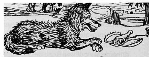
Il·lustració extreta del conte Encara parlen les bèsties , de Josep M. Folch i Torres.

A l'Estany diuen que es feien servir parany per agafar els llops. A cada casa de Castelltallat (Sant Mateu de Bages) hi ha encara d'aquests parany llopers.