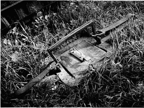
Parany lloper bo i disparat