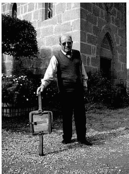
Parany lloper bo i parat. El Soler de Sant Cugat (Navàs)

Les armes de foc, les cordes arrossegant-se, els collars de punxes, els parany llopers o fins i tot la música, són d'altres sistemes que van sortint en aquest passeig per l'enginy d'una gent d'una època en què s'anava a peu pels afraus de la comarca i quan es ponía el sol podia passar-hi més o menys de tot.