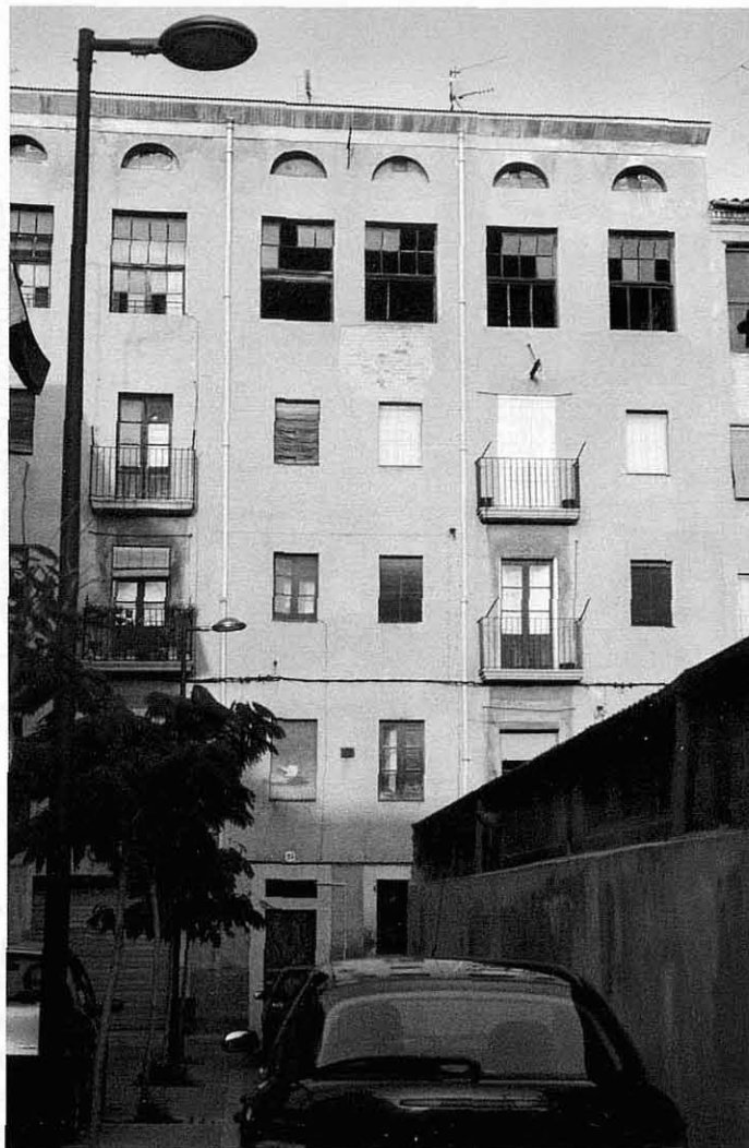
Casa del carrer Santa Maria amb els finestrals d'un obrador vetaire a l'últim pis

La defensa de la conservació d'un edifici, o bé d'un conjunt d'edificis, o d'un paisatge determinat per part de les persones que hi han treballat, els seus descendents o senzillament els vianants que es complauen en observar aquelles parets, estructures, o