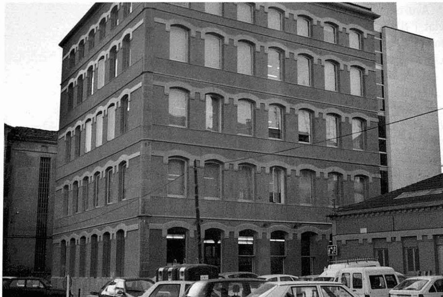
Edifici rehabilitat de la fàbrica Balcells a la plaça Montserrat

Si un edifici es pot convertir en museu industrial aquest ha de ser viu, hi ha d'haver màquines que funcionin, exposicions renovables i, especialment, la implicació de persones interessades. Un museu tèxtil o de cinteria s'ha de fer a base de comptar amb voluntaris que hi col·laborin, des d'empresaris a tècnics i obrers. Molts museus d'aquest tipus funcionen amb la col·laboració de persones que ja han deixat l'activitat laboral i que tenen coneixements directes del sector. En alguns museus es monten cursos d'artesanía per ensenyar a qui vulgui a teixir en telers manuals, es fan exposicions d'antics mostraris de productes, s'ensenyen els mecanismes del funcionament de les màquines, hi ha exposicions de fotografies del treball en les fàbriques, sessions d'història oral, exposicions sobre determinades empreses i famílies d'industrials, etc. No cal que la instal·lació museística ocupi molta superfície, cal que sigui adequada i que hi hagi una entitat, una associació, que vetlli pel seu funcionament conjuntament amb els responsables públics.