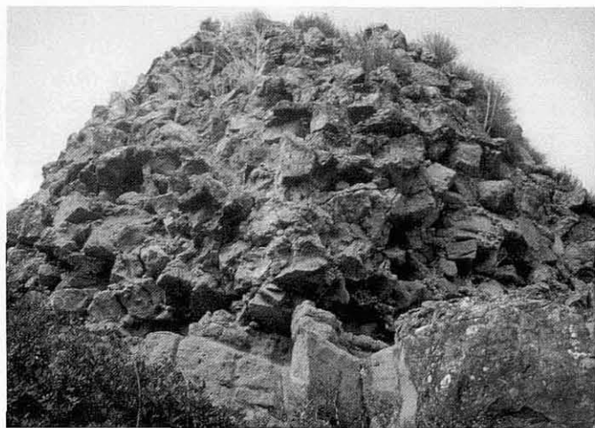
La torre vista des del NO, parcialment descalçada.

completament encarats a muntanya, veurem el castell de Cardona; era propi en època medieval que des d'un castell se'n veiés un altre. Més propera que Cardona tenim, enmig d'uns camps, Cunill , masia també deshabitada i mig enrunada. I a l'est, no apreciable des d'on som, hi passa el riu Cardener, just pel peu del turó on ens trobem, on l'aigua forma un meandre.