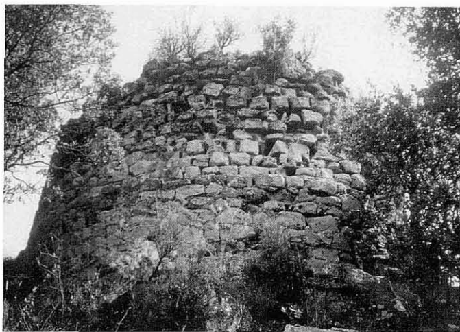
La torre vista des del NE, on presenta la part millor conservada. Als peus veiem el cingle on es fonamenta.