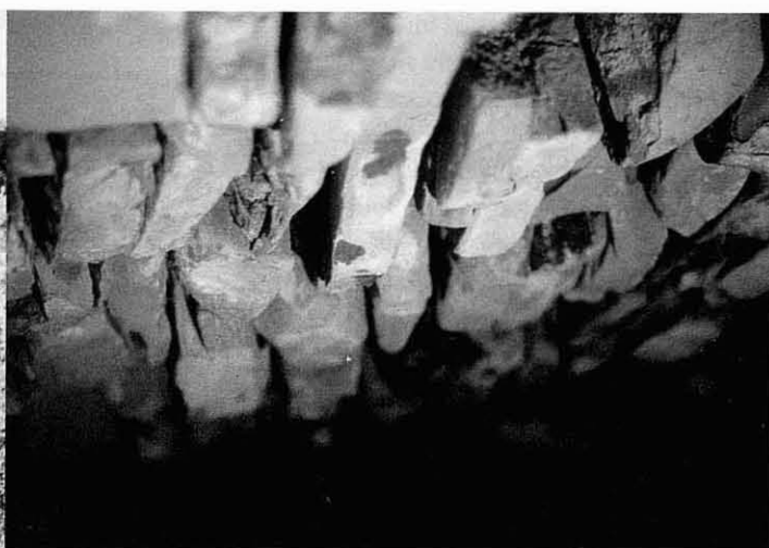
Barraca de Les Llobatonès. Interior.

viar o intentar tornar al seu lloc les pedres trencades o escampades (habitualment es troben al mateix lloc), afegir els rebles o pedruscalls necessaris i cobrir la teulada amb terra 5 .