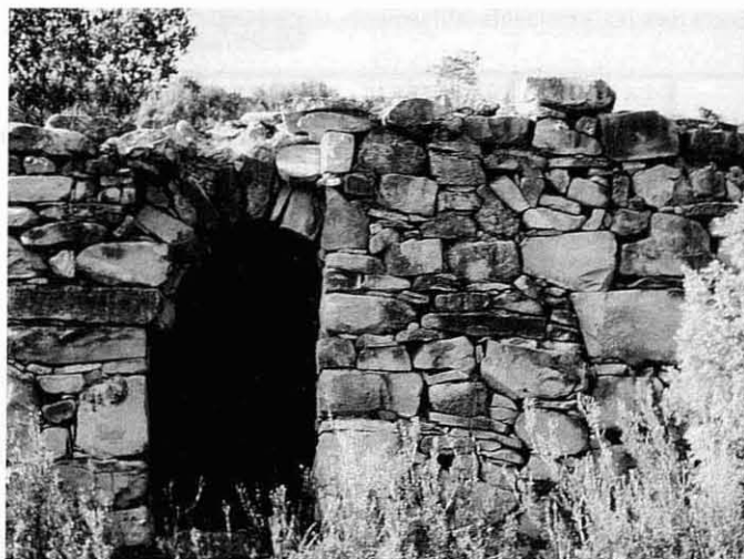
Barraca de Les Llobatonès