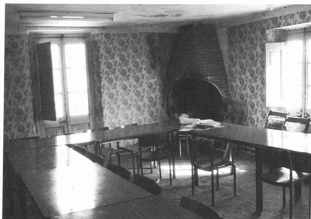
Pis de dalt de la Casanova de Castelltallat on hi havia hagut ubicada l'escola de Castelltallat.

vaig amagar per aquí aquests boscos. Tenia una barraca molt ben parida al bosc, no hi tenia fred, no! El menjar me'l portaven d'amagat. Bona part de la guerra vaig estar amagat. Vaig estar molt temps amagat a Cal Jaume Manuel, una casa que avui està ensorrada, al fons de la riera, vora la línia elèctrica. Aquella gent em portaven el menjar torrent amunt, el deixaven amagat en un lloc. El meu cosí estava amagat a casa de l'amo, al Sunyer de Valldeperes. (...) On va morir molta gent va ser a Querol a Fonollosa. A sobre el cementiri l'exèrcit republicà va fer front, això ja era en la retirada."