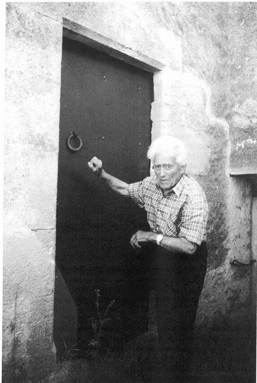
En Pepet ensenyant la porta de Cal Pons on va trucar la Guàrdia Civil quan el van anar a detenir.

Sant Mateu de Bages va ser una zona on van operar durant molts anys el maquis. Ens explica que un temps