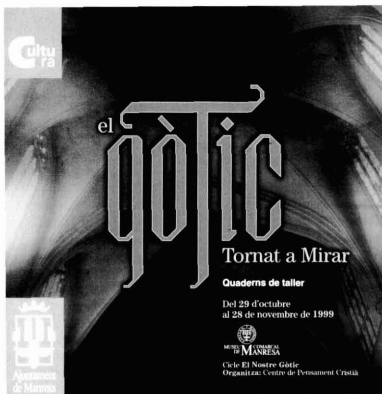
Catàleg de l'exposició "El gòtic tornat a mirar", presentada al Museu Comarcal de Manresa.

El segle XIV manresà ha estat qualificat com a segle d'or . Aquest qualificatiu no ens ha d'estranyar gens, ja que durant aquest període la ciutat vis-