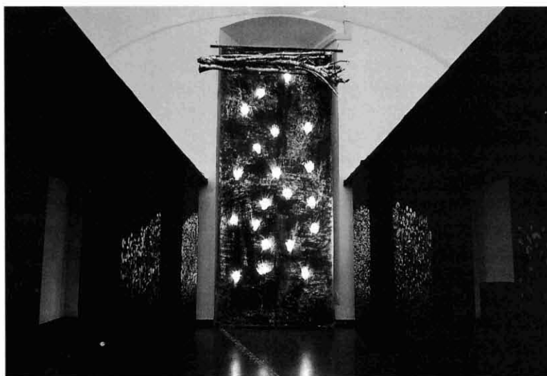
Aspecte de l'espai transformat en una planta gòtica, de l'exposició "El gòtic tornat a mirar".