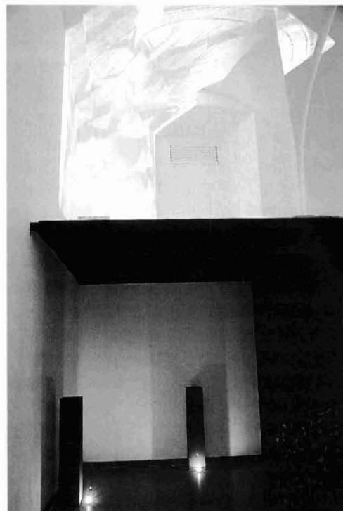
Exposició al Museu Comarcal de Manresa.