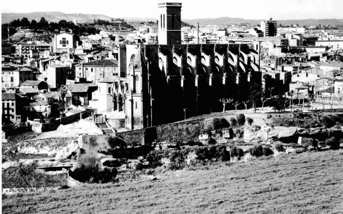
La col·legiata-basílica de Santa Maria de la Seu és una reeixida mostra de l'art gòtic català. La seva ubicació, al capdamunt del Puigcardener, conforma la imatge més clàssica i monumental de la ciutat de Manresa.

començar a manifestar-se a finals del segle XII i perdurà fins al segle XVI. En l'exposició que presentem podreu veure peces d'art litúrgic, creus processionals per exemple, que són del segle XVI ben avançat i també alguna presència d'obres d'orfebreria del segle XVII, però de tradició encara ben gòtica.