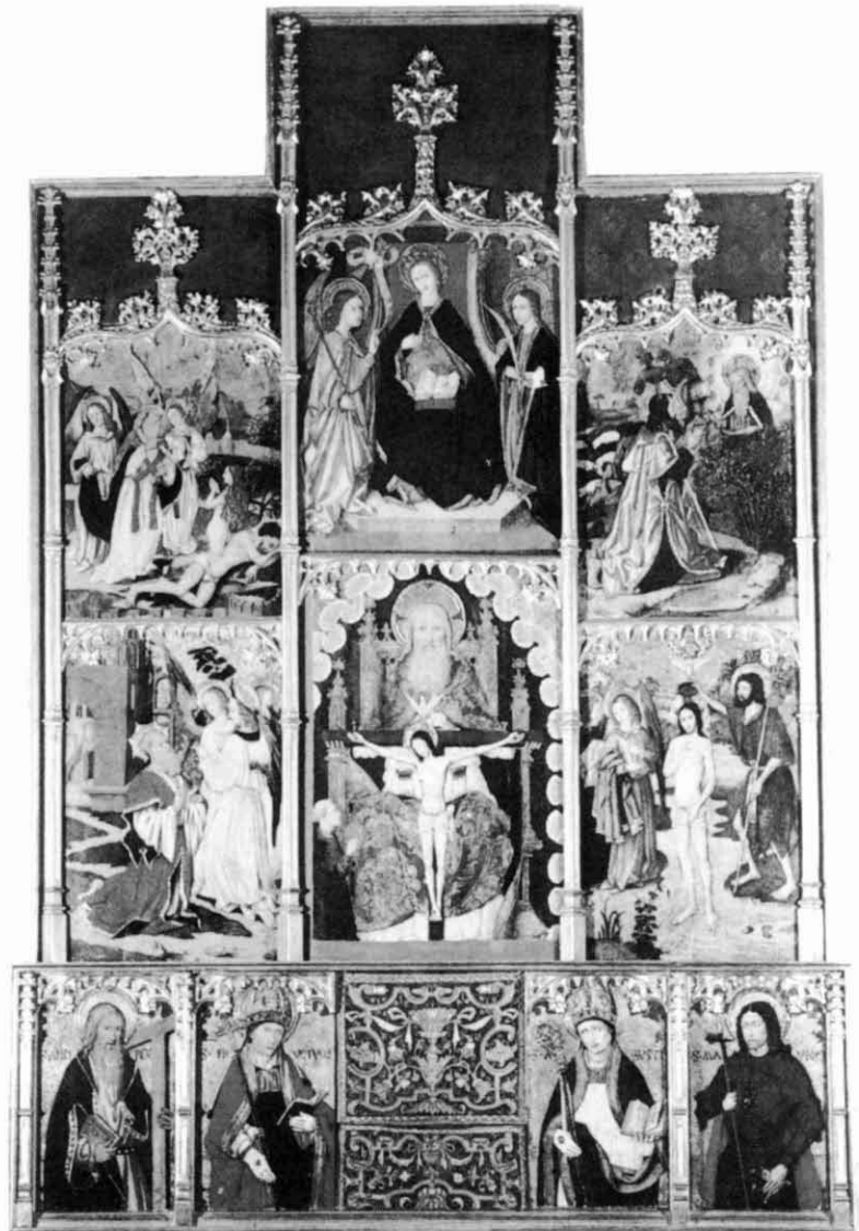
Retaule de la capella de la Santíssima Trinitat, obra de Gabriel Guàrdia (1501). Seu de Manresa

El gòtic és un fenomen de la baixa edat mitjana. El que anomenem Edat Mitjana s'iniciava amb la caiguda de l'Imperi Romà (any 476 aproximadament) i acabà el 1453 amb la de l'Imperi Bizantí; un mil·lenni, si fa no fa: de l'últim quart del segle cinquè a la meitat del segle quinze. S'acostuma dividir-la en Alta –del segle V al X– i Baixa –segles XI al XV; aquesta, subdividida en dos períodes, que són l'època romànica (ss. XI, XII i mig XIII) i l'època pròpiament gòtica (de mitjan segle XIII ençà, incloent tot el XV). El gòtic començà, de tota manera, ja va