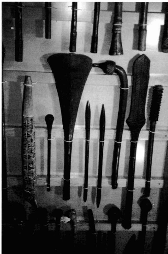
Trencaclousques o masses procedents d'Oceania

cionisme més especialitzat que es centra en les armes dels pobles en estat de civilització elemental. Reben aquestes la denominació general d'armes etnològiques.