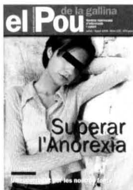
Portades de les publicacions participants a la taula rodona.

si no, els anunciants de seguida comparen i, amb el bombardeig d'oferta publicitària que hi ha, quedes arraconat. Però és un hàndicap bastant insalvable.