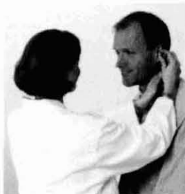
C8/C18 Universal i potent

Per a més informació, consulteu el vostre audioprotesista