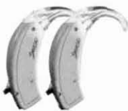
C9/C19 Direccional i direccional potent