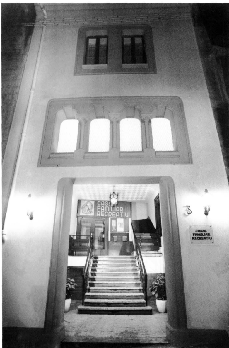
Vista actual de l'entrada de l'edifici, des del carrer Sabateria.

L'escenari d'Els Carlins, al Casal Familiar Recreatiu, continua sent un dels nostres teatres en funcionament. L'entitat és seu d'una rica tradició de teatre amateur, motor de premis, grups i representacions, i l'organitzadora avui dia d'un dels quatre cicles professionals de teatre a la ciutat: el de Butaca, pensat per al teatre de format petit i mitjà. Vinculada primer al grup ideològic que va donar sobrenom a l'entitat (la Joventut Carlista Manresana), el que n'ha garantit la supervivència –a punt de fer el segle de vida– ha estat la seva capacitat oberta i integradora de gent i il·lusions sempre renovades.