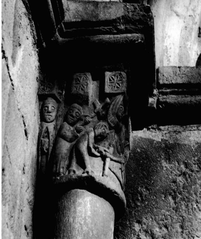
Mura. Capitel·l romànic de l'església parroquial de Sant Martí.

los, els que calguin; no podem pensar en Sant Benet de Bages com a atractiu turístic de la manera que està: molt bucòlic però també molt atroïnat o a fer la ruta ignasiana fent passar el visitant pel depauperat indret de Sant Ignasi Malalt. I, finalment, fer-ne el rebombori que calgui allà on calgui, que tothom ha de ser benvingut.