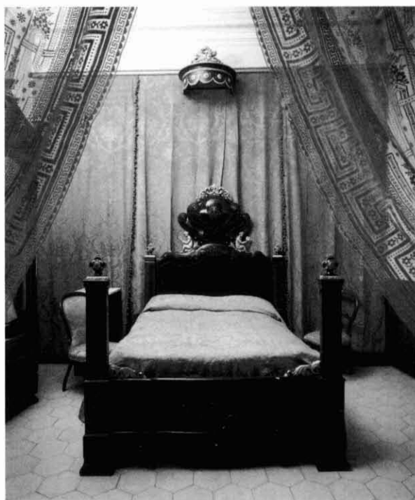
Mobiliari de la Casa-Museu Torres Amat de Sallent. Es tracta d'un interessant casal noble dels segles XVIII-XIX, que bé mereix una visita.

tant, no podem ofertar morenor satinateda de platja ni brillant de muntanya. Però podem ofertar altres coses: tranquil·litat, paisatge (sí, sí, paisatge), monuments, gastronomia, vins, etc. Una oferta que molts llocs dels considerats d'estiueig o d'escapada tradicionals no poden donar en conjunt.