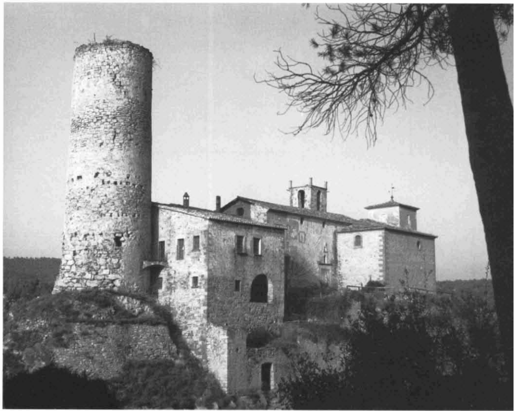
Castell de Fals (Fonollosa), un magnífic exemple de torre de guaita medieval. Al seu costat hi ha l'església parroquial i la rectoria. Per Nadal fa de marc al famós "Pessebre Vivent del Bages". (Foto: S. Redó).

H eus ací un article oportú. El seu autor mostra de manera tan clara les possibilitats turístiques del Bages que, una vegada feta la seva lectura, tothom s'haurà adonat del magnífic patrimoni –arquitectònic, natural, cultural o gastronòmic– que tenim deixat de la mà de Déu. Unes reflexions en veu alta que intenten desvetllar-nos de l'apatia que habitualment tenim envers el que ens envolta. Tots hem esdevingut alguna vegada turistes en comarques veïnes o allunyades, o fins i tot, en països estrangers. I allò que allí ens ha atret i hem admirat, potser també ho tenim a casa nostra i no hem fet cap esforç per adonar-nos-en i enaltir-ho. Potser ja seria hora de començar a canviar aquesta dinàmica.