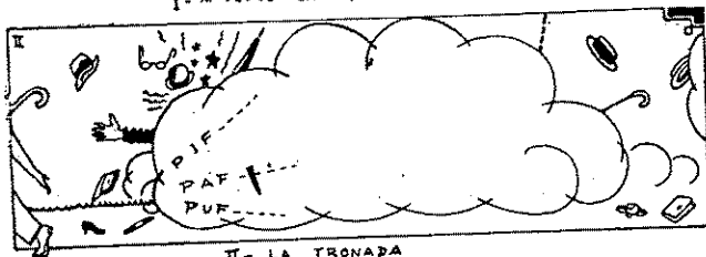
II - LA TRONADA