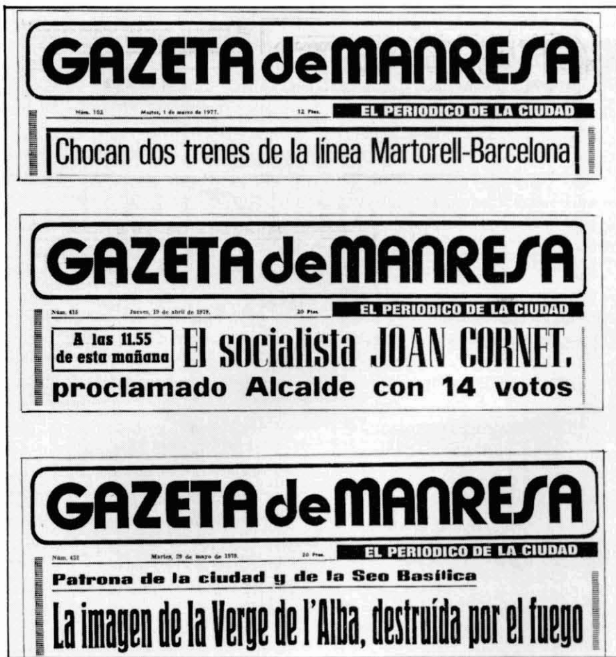
Capçaleres i titulars de Gazeta de Manresa , periòdic que es publicà des del gener de 1976 al desembre de 1982.