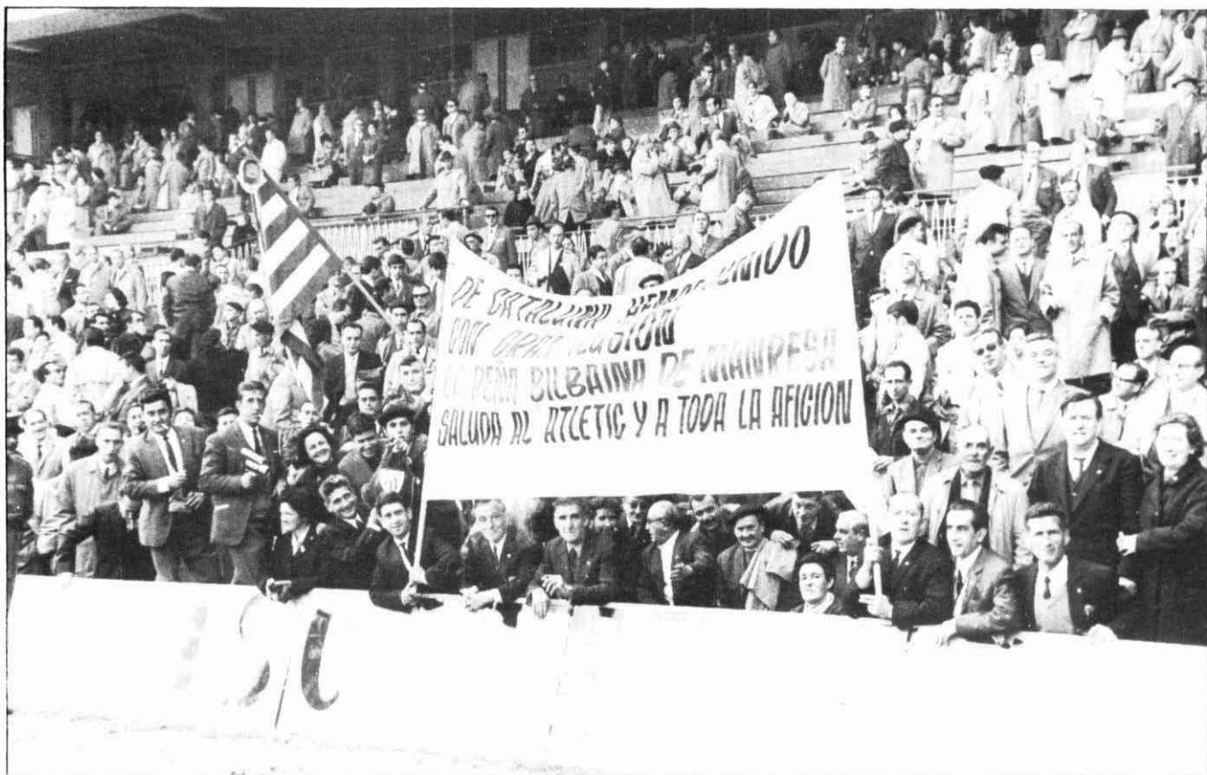
Primera visita de la naixent Peña Bilbaina a San Mamés, l'abril de 1967.