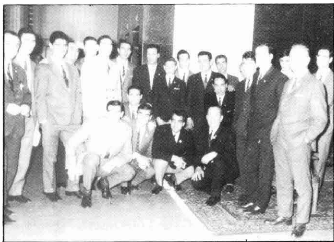
La junta directiva de la Peña Bilbaína de Manresa amb alguns directius i jugadors de l'Athlétic de Bilbao, encapçalats pel mític Iribar, al hall de l'hotel Majèstic de Barcelona. Any 1971.