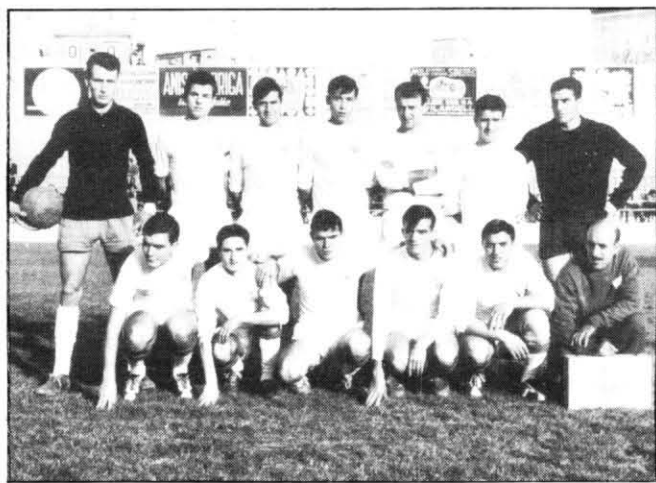
Un dels primers equips de la Penya Sevillista al camp del Pujolet. Temporada 1962-63.