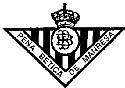
Escut distintiu de la Penya Bètica de Manresa, fins a fa poc revitalitzada dins la categoria de futbol dels veterans del Bages.