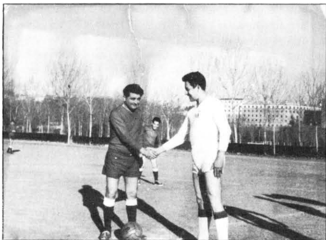
Inici d'un partit de futbol entre la Penya Sevillista i un combinat d'aficionats al camp antic d'El Congost al principi dels 60.