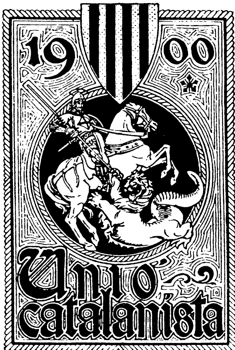
Segell de propaganda de la segona emissió que en féu la Unió Catalanista (1900).

Les Bases de Manresa, com qualsevol fenomen històric, són fruit d'un context determinat. Aquest article respon a aquelles qüestions que sovint s'obliden, tot i ser d'importància cabdal, com per exemple què és i d'on prové la Unió Catalanista, o quin paper juguen en el món del catalanisme algunes opcions polítiques tan populars com el carlisme o el federalisme. Aquest escrit ens dóna, doncs, una concisa aproximació als grups polítics i culturals dels inicis del catalanisme, tot situant les Bases de Manresa en el seu context precís.