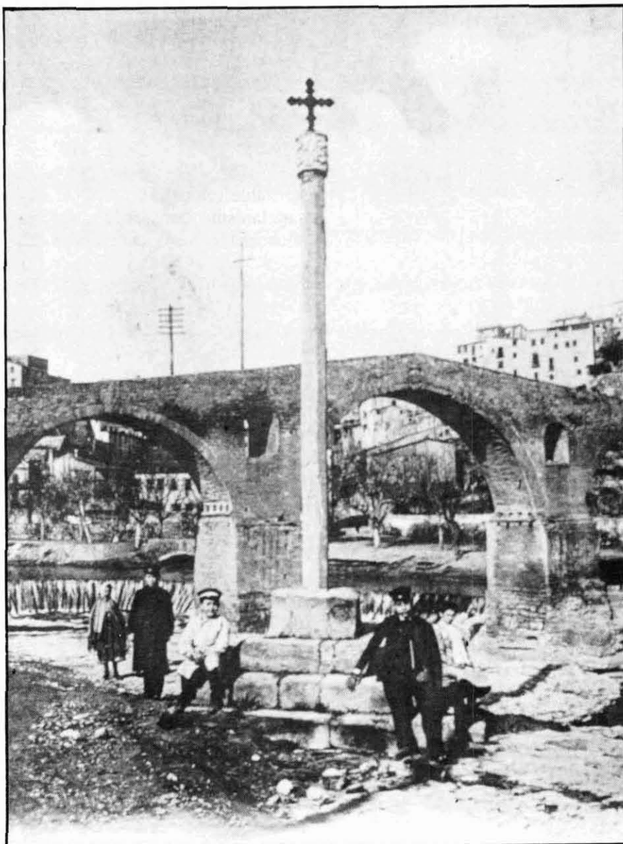
El Pont Vell de Manresa en començar el segle.