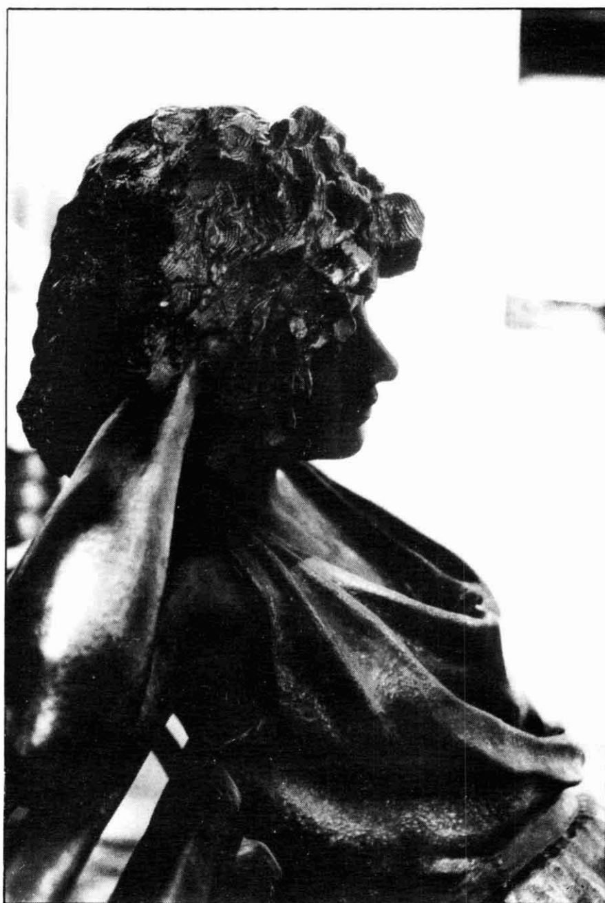
«A l'ombra», localitzada a la Plana de l'Om, s'ha convertit en una de les escultures més populars de Manresa.