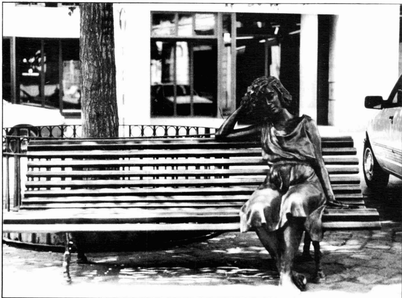
«A l'ombra», a la Plana de l'Om de Manresa.