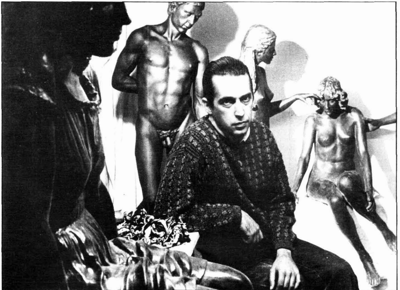
L'artista, envoltat d'algunes de les seves creacions