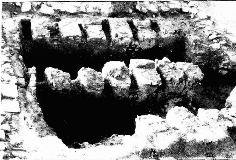
Forn de terrissa romà de Boades (Castellgalí) al sector de Cal Roc. Fou localitzat als anys trenta i excavat extensivament al 1985. Una vegada estudiat, fou de nou soterrat per tal d'evitar la seva degradació.

Arqueòleg, llicenciat en Prehistòria i Història Antiga