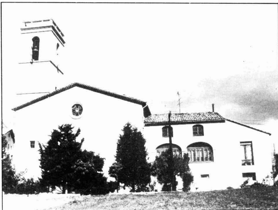
Vista general de l'església parroquial i rectoria d'Avià, seu de la Junta del Principat de Catalunya.