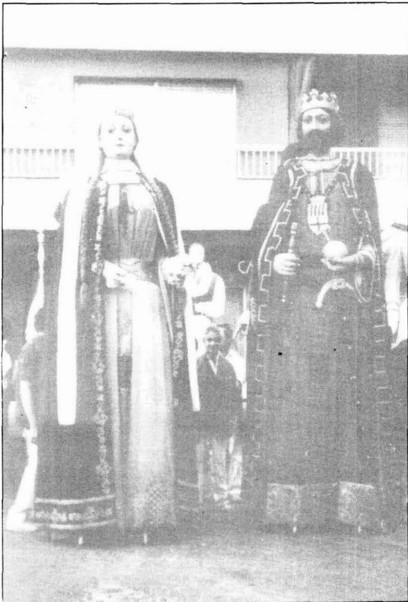
Gegants vells de Manresa

No podem pas dubtar del resultat aconseguit o de la qualitat artística que oferia aquesta tripúdia, éssent obra d'un artista de reconeguda fama, autor, cal dir-ho, d'altres entremesos de la Ciutat, com l'Àliga (1593), el Drac (1597) o la Mulassa (1597 ?) o també d'autèntiques peces de qualitat i mèrit artístic, com els escuts del Llibre Verd, o la fàbrica del Crucifix de la Casa de la Ciutat.