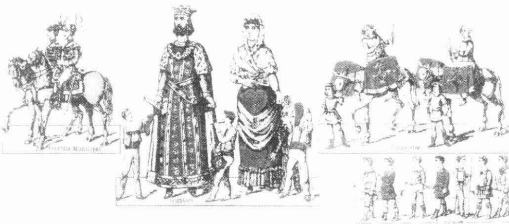
A dalt, l'encapçalament de la professó de Corpus segons dibuix de la segona meitat del segle XIX. Abaix, representació del segon terç del mateix segle del lleó.