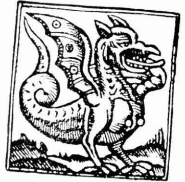
Un drac i una vibria segons un gravat setcentista.