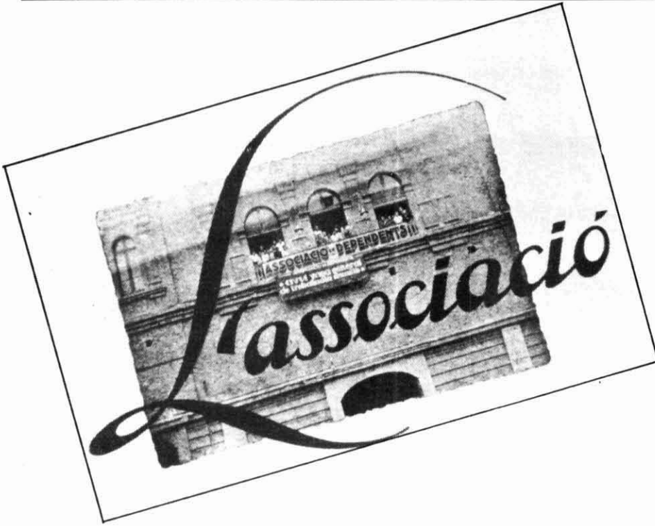
L'Associació de Dependents del Comerç i de la Indústria, que tenia la seva seu social al Conservatori, va protagonitzar una important vaga el juny de 1936. (Font: revista Moments , juny de 1937).

tava el descrèdit i la maliança envers tot allò relacionat amb la política i, com a conseqüència, la poca participació electoral.