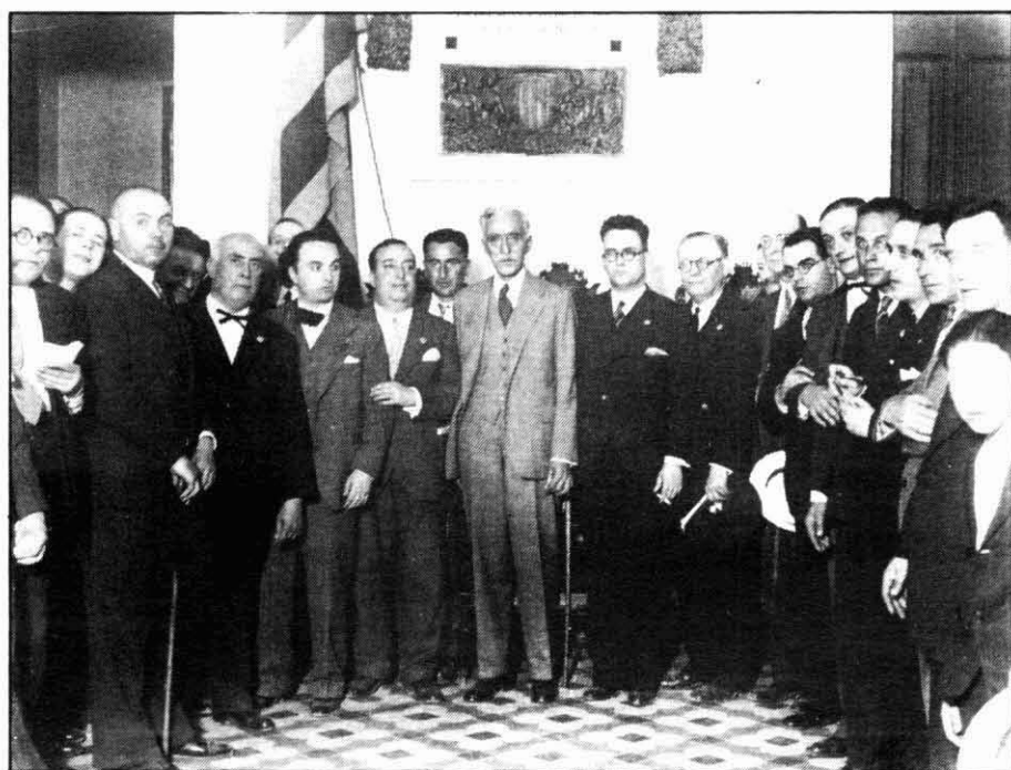
Francesc Macià, amb Ventura Gassol i l'Alcalde de Manresa Selves i Carner, al Saló de Plens del Consistori manresà. (Foto: Arxiu Gamisans).

van ser les forces d'esquerra les que van obtenir la victòria. De tota manera, és clar que ERC era el partit majoritari i el que recollia més àmpliament la confiança dels treballadors manresans. Aquesta era, sens dubte, una opció de vot útil, sobretot davant la dreta. Per això es votava ERC, malgrat el caràcter moderat dels republicans i els seus estrets lligams amb la petita burgesia. Tanmateix, aquesta confiança electoral no significava per força una identificació total amb els republicans. Així veiem com en diverses ocasions (eleccions d'abril de 1931, gener de 1934 i també el maig de 1936), i al costat de l'expressió pública i multitudinària d'alegria per la victòria, els representants dels sindicats de la ciutat expressen públicament per mitjà de manifestos les seves aspiracions i demandes de caire polític i sindical a les noves autoritats municipals d'esquerra. És a dir, manifesten peticions pròpies i diferents. D'aquesta manera s'expressava una voluntat no sols de suport a l'opció d'esquerres per la qual s'hauria votat, sinó també una voluntat de diferenciació i de presència pública parapolítica. També es podia donar a entendre la importància del pes de la classe treballadora en el triomf de les esquerres.