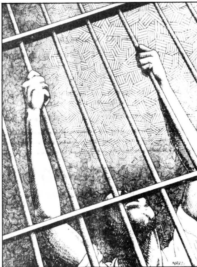
En les eleccions de febrer de 1936 el tema dels empresonats per la repressió posterior al sis d'octubre -es parlava de trenta mil presos- va ser un dels temes centrals. (Font: El Dia , 10-2-1936).

La guerra civil del 1936-39 ha d'entendre's no com un fet aïllat en la història, sinó com una conseqüència o un pas més en l'evolució d'uns fets socials, polítics, econòmics, etc., que arrenquen força abans que aquella tràgica data del 17 de juliol de 1936. En el present article es dona a conèixer una breu aproximació a l'activitat política que es desenvolupava a la ciutat de Manresa en els anys anteriors a l'esclat de la guerra.