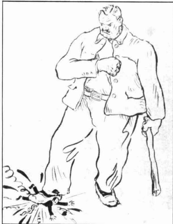
Des de l'accés de Hitler al poder, el feixisme va suscitar un gran temor i una enèrgica reacció per part del moviment obrer. (Font: Defensa Obrera , abril de 1934)