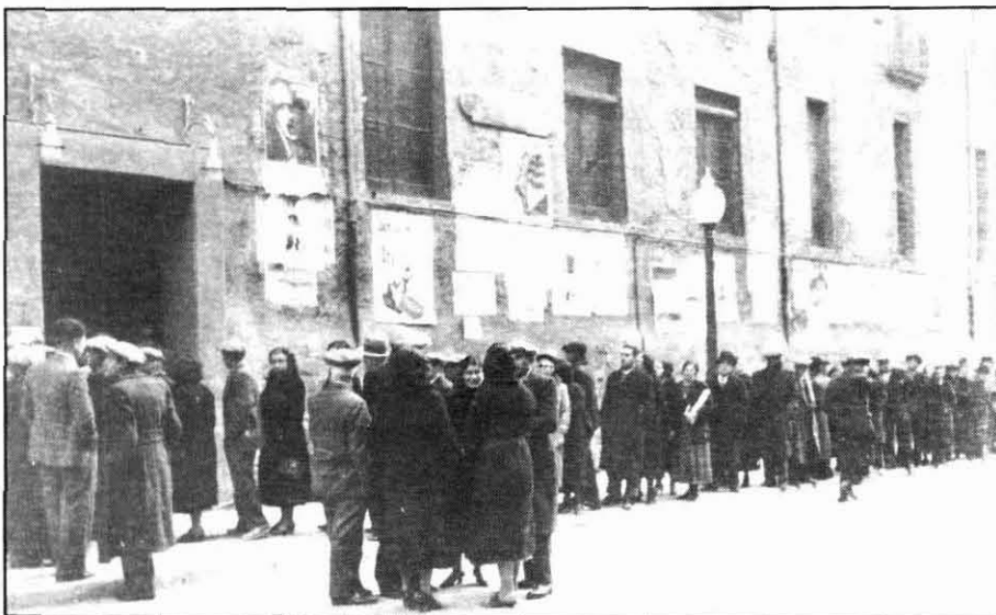
Cua de manresans al carrer de Jaume I en les eleccions de febrer de 1936. Fins 50 anys després no es tornarien a celebrar eleccions lliures i per sufragi.

Aquest fet explica la creació d'un panorama multiforme en el que convivia comitès extremadament radicals -els anomenats de la «llamarada»- amb d'altres molt més moderats en la seva acció. I els esforços de coordinació que hom féu -a través de la constitució de comitès comarcals- no sempre varen reeixir: en la pràctica cada comitè actuava segons propi criteri i sense obeir més ordres que la