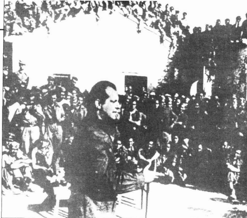
El poeta Rafael Alberti en una alocució als milicians de Catalunya en un poble no identificat de la zona de Lleida.

L'estratègia diferenciada d'aquests dos blocs va motivar una conflictivitat permanent que va durar tota la guerra i malgrat la consciència generalitzada que calia mantenir la unitat antifeixista com a condició per guanyar la guerra, hom no va poder evitar tot un seguit d'enfrontaments que abocaren en els combats armats que varen