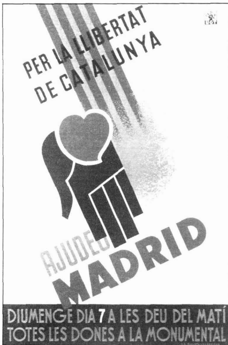
Crida del sindicat de Dibuixants Professionals per ajudar la resistència de Madrid a través de roba i donacions.

Contràriament, el camp català no es va veure tan afectat per les col·lectivitzacions, que només varen tenir una certa presència a les terres del Baix Ebre i a alguns indrets del Baix Llobregat. Malgrat que la CNT no va abandonar els intents de col·lectivització agrària i que en alguns casos la forçes -cosa que va provocar tensions i incidents més d'una vegada-, la pagesia catalana va optar majoritàriament pel manteniment de la petita propietat i per la redistribució d'aquelles terres que havien estat ex-