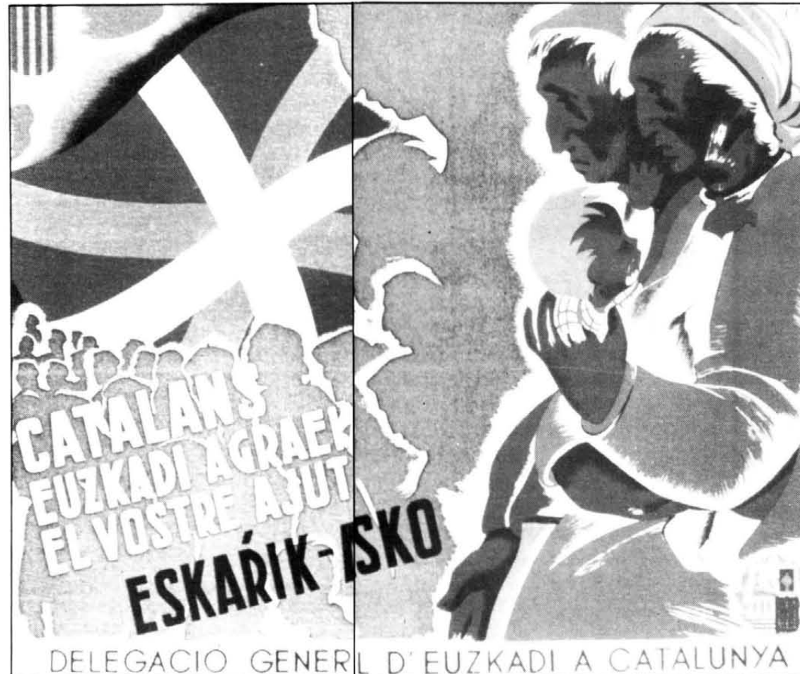
Cartell de Serra Molist editat per la Delegació General d'Euskadi a Catalunya com a agraïment a l'ajut rebut de Catalunya mentre es mantingué el front del nord i, un cop caigut, per acollir els nombrosos refugiats bascos i el propi govern d'Aguirre.

Paral·lelament, a partir del mes de novembre de 1936, es va començar a experimentar una davallada sensible de la producció industrial. Si, com a resultat de les necessitats bèl·liques, s'havia produït una certa revifalla de la indústria metal·lúrgica, en canvi el tèxtil i la construcció varen caure en picat. Les dificultats que aviat varen tro-