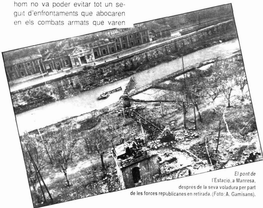
El pont de l'Estació, a Manresa, després de la seva voladura per part de les forces republicanes en retirada.

Perquè el maig de 1937 havien fet la seva aparició a la reraguarda catalana tot un seguit de problemes de subsistència que esdevindrien congènits. Certament, Catalunya i, per extensió, tot el territori que s'havia mantingut sota el control de la República es van trobar a l'inici de la guerra en una situació extremadament complexa: és cert que la República controlava el 60% del total de la població espanyola, els principals nuclis industrials, les ciutats econòmicament més importants del país i l'agricultura d'exportació -com la taronja, l'oli i el vi-, però, en canvi, els grans centres productors de cereals havien quedat sota el control dels militars insurrectes. Als anys 30 Catalunya