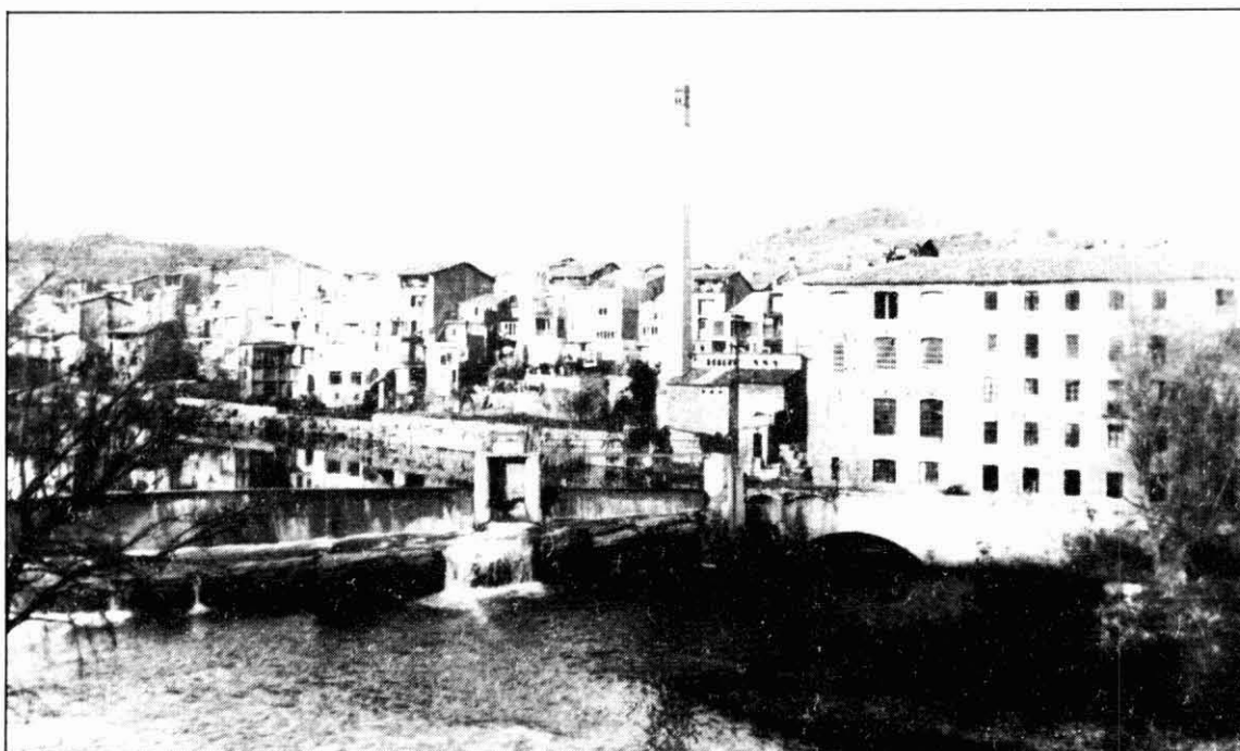
Sallent ha crescut a la riba esquerra del riu Llobregat.

En tornar invictoriós d'allí, les tropes de MacDonald es dedicaren a saquejar les cases dels contorns de Solsona fins a la Ribera Salada i el Cardener, així com hom sembrà el pànic per Lladurs i el Pla de Rialb. MacDonald, hom diu, va tenir