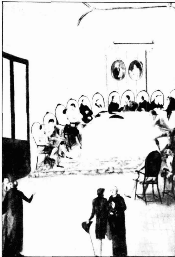
La Junta de Defensa de Manresa el 1808. Pintura mural de 1811 al mas les Ferreres de Rellinars.

El 7 de març de 1793, la Convenció francesa declarà la guerra a Espanya, i el rei Carles IV, monarca de dues misses diàries, que es llevava a les cinc del matí, que no bevia ni vi ni licors, que només va conèixer una dona, la seva, amistançada amb Godoy i d'altres, però que mai va donar l'hora malgrat col·leccionar rellotges, rebé el misatge a Aranjuez el 23 de març. Espanya es considerava en l'obligació dinàstica de venjar Lluís XVI en l'ivent del Dr. Guillotin, i l'exèrcit, ma-