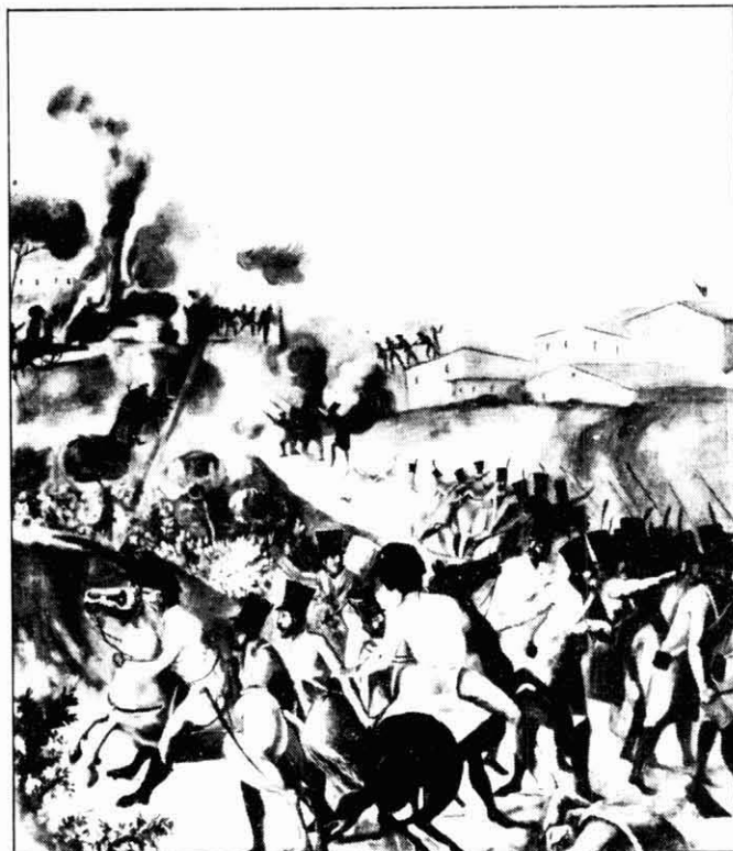
Segona batalla del Bruc el 14 de juny de 1808. Segons pintura del mas les Ferreres (1811). (Foto AHCM).