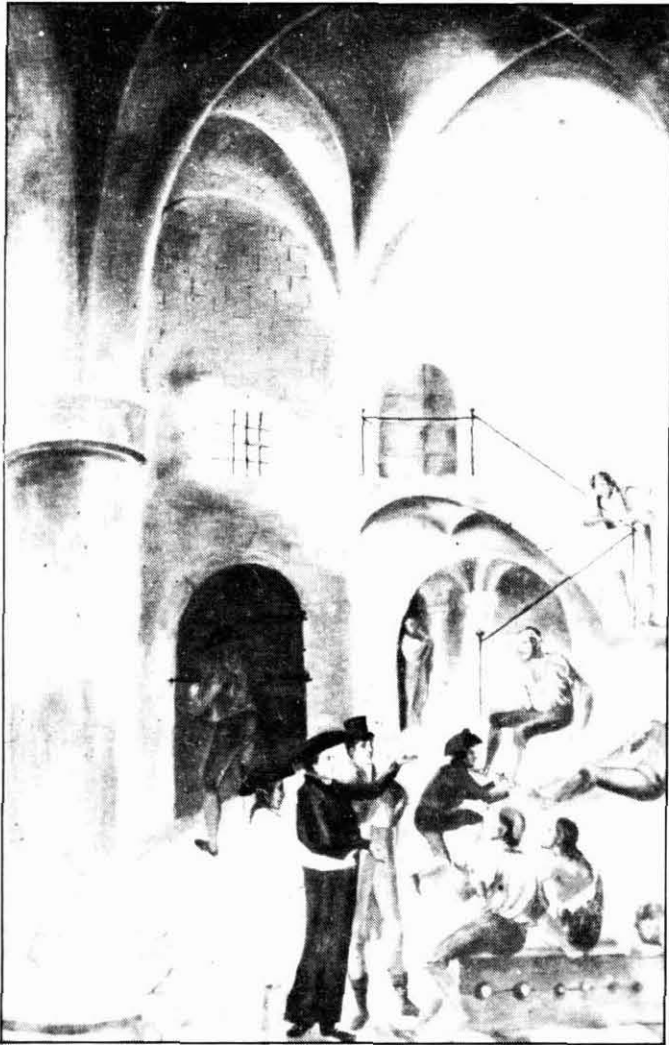
Alliberament de presos de la presó de Manresa. Juny de 1808. Pintura mural del mas les Ferreres de Rellinars (1811).

1809 és l'anyada de la revolució dins la guerra, 1810 és l'any de la resistència més activa, 1811 significa davallada i reorganització, 1812 fam, Constitució i Nova Catalunya, mentre a principis de 1813, quan tothom anhelava la pau i les Corts abolien la Inquisició, l'assaig napoleònic entrarà en decadència ran la desfeta del Francès a l'estepa russa.