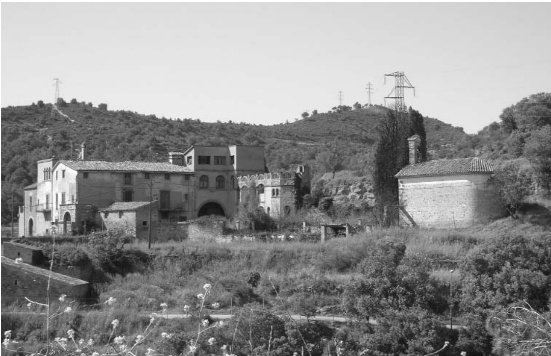
Mas de les Farreres i capella de Sant Felip Neri (Rellinars)