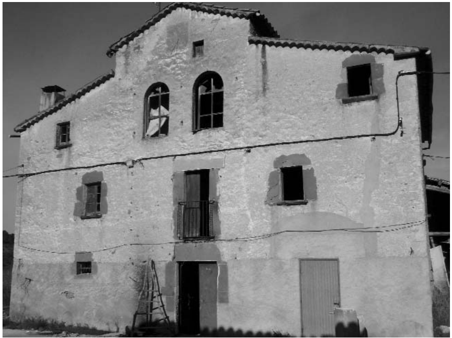
Masia de Can Cotis (Rellinars).

Can Cotis i les Farreres moren i s'ensorren davant d'uns Plans que no poden fer res sense l'ajut dels organismes oficials i sense la col·laboració de llurs propietaris. Com hem dit abans, no són casos aïllats al nostre territori però, tot i així, potser encara podem fer alguna cosa per salvar-les abans que sigui inevitable.