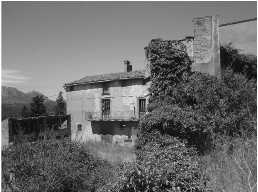
Vista de l'entrada del mas de les Farreres (Rellinars)

No tenim notícies d'alguns anys però coneixem dades disperses dels qui van ajudar a construir la casa que, amb ampliacions diverses i noves estades de masoveria, molí, etc., és la