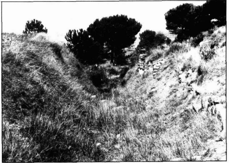
Vestigi del camí St. Fruitós-St. Benet, travessant la carena.