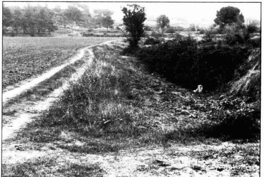
Camí de St. Fruitós a St. Benet. (Foto autors).

Però ja és hora que exposem d'una vegada els indicis que ens autoritzen a parlar d'una centuriació. En una visió general, els límits de la plantila coincideixen, pel Nord, amb el límit actual del terme municipal de Sant Fruitós, que no és altre que el de l'antic terme de Manresa. I és precisament per aquest indret per on comença la primera descripció que en tenim. Per l'Est, el límit coincideix amb el peu de la lletra amb un bon tram de la carretera, que segueix l'itinerari, per sobre o paral·lela, per on devia passar el camí-límit oriental i, potser, la via, o en tot cas, el que sí és segur segons Benet, el camí medieval. La situació de la centuriació vindria determinada pel riu Llobregat -com també succeeix en altres centuriacions. En termes generals es pot apreciar una sensible conciliació entre els camins i la perpendicularitat de la possible retícula. Especialment hem de ressaltar el camí de les Oliveres, que seria un dels eixos de la centuriació dividint-la horitzontalment en dues meitats. Aquest camí es conserva en la