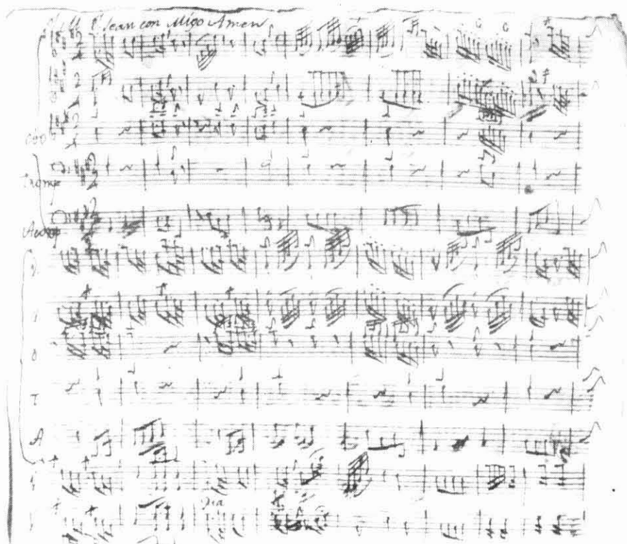
Fragment d'un dels manuscrits musicals recuperats a la Seu de Manresa.

La Capella de Música era el grup encarregat de tota la música que es feia a la Seu. El Mestre de Capella n'era el director; a més tenia obligació de compondre, d'assajar, i d'ensenyar música, cant i donar un ensenyament global als nens (escolans) que cantaven en aquesta capella. Tot i que no s'explicita en la relació de les seves obligacions, però, el Mestre és quelcom més que això: és un càrrec de confiança del Capítol de Canonges que és qui, en definitiva, exerceix l'autoritat i administra els béns en la comunitat de preveres que viuen a la Seu i que sovint al llarg del segle XVIII sobrepassen amb escreix el mig centenar. És per això que el Llibre de Consueta preveu que el Mestre de Capella tingui un salari millor si és prevere que no pas si és laic (i el mateix succeeix amb l'organista). D'aquesta