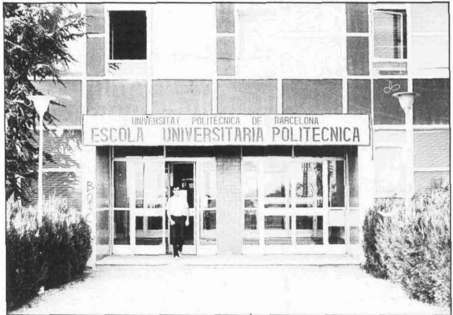
Façana del nou edifici que acull l'Escola de Mines. (Foto Jordi Perramon).

En les qüestions econòmiques encara era més palesa la precarietat de mitjans de l'Escola, gens estranya dins el context general de la postguerra. En efecte, per la seva subsistència, "L'Escola de Mines" (com fou coneguda popularment) s'havia de refiar de les subvencions de les empreses mineres de les conques del Llobregat i Cardener. Cadascuna d'elles ho feia, en principi, amb una qualitat d'unes 6.000 ptes anuals. No totes elles trobaven l'acord satisfactori: es pot ressaltar el cas de la "Sociedad Anónima La Minera" de Balsareny que, si bé aporta la seva part de la subvenció, fa constar que "... vista la diferencia en la importancia y en otras circunstancias de las minas de potasa, el reparto de los gastos sobre dichas minas en otra forma hubiera sido