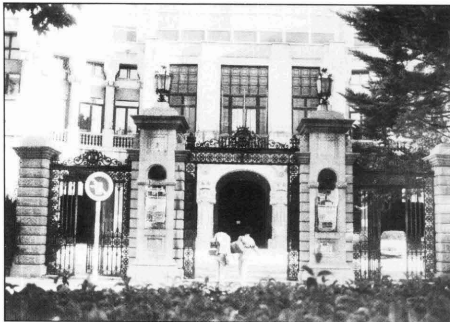
L'Institut Lluís de Peguera bostatjà la primera seu de l'Escola de Mines.

Respecte a l'evolució de l'alumnat dins el període 1957-64, val a dir que presenta una certa fluctuació quant a les matrícules deguda bàsicament a la duplicitat de plans d'estudi i a la introducció de la modalitat de matrícula lliure. A més, per una banda existia el pla d'estudis antic dels Facultatius de