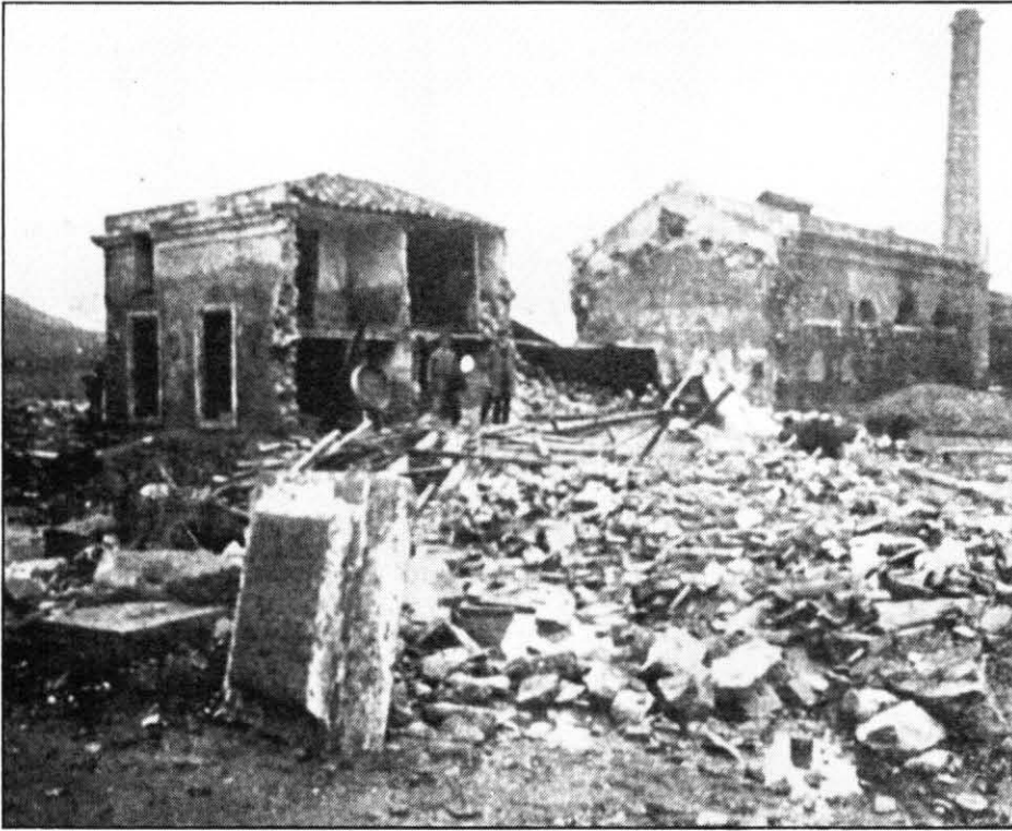
Una de les moltes fàbriques afectades per l'aiguat.

meses, el Pont de Ferro del ferrocarril Manresa-Berga, arrossegat, la passarel·la de passatgers del ferrocarril del Nord, enfonsada per abatiment de pilastres, el pont de la línia fèrria de més avall dels Comdals afectat, les carreteres a Esparreguera i a Can Maçana tallades.