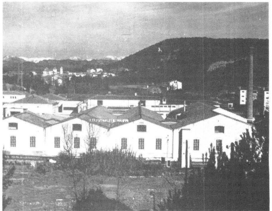
Vista general de la Colònia Valls

En aquesta línia d'argumentació cal revisar els propòsits de la venda, la botiga i els serveis proporcionats per l'empresa a la colònia. S'ha dit que els preus de les botigues i els lloguers de les vivendes disminuïen notablement les retribu-