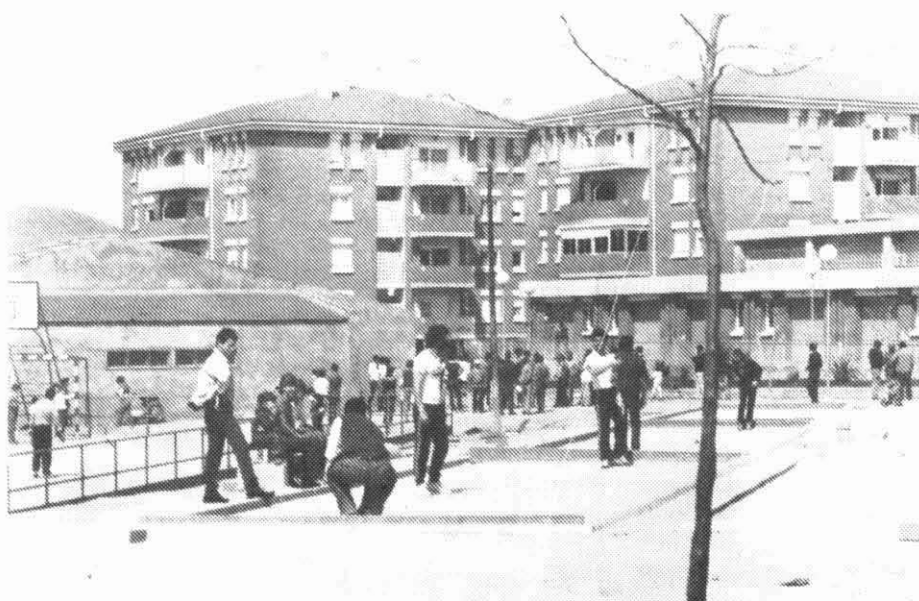
Vista parcial del polígon: un aspecte de la vida del barri.

Els desplaçats d'altres localitats són 32 famílies (6,4%), la meitat de les quals provenen de Sant Joan de Vilatorrada. Finalment, desconexim la procedència de 5 famílies (1%). En total, sumen, doncs, 496 famílies.