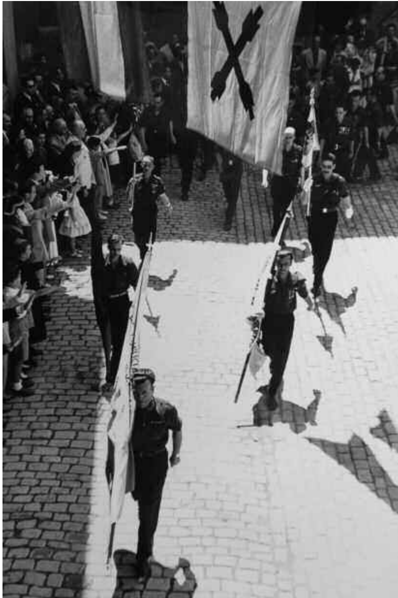
Desfilada falangista a Manresa, el juliol del 1954

Les fotos procedeixen de l'Arxiu Comarcal del Bages i de diverses col·leccions particulars. Hi ha imatges del període de la República a Manresa, de l'entrada de les tropes franquistes, de nombrosos actes franquistes, de diverses celebracions religioses: processons, visita de la Mare de Déu de Fàtima; fotos de la Fira