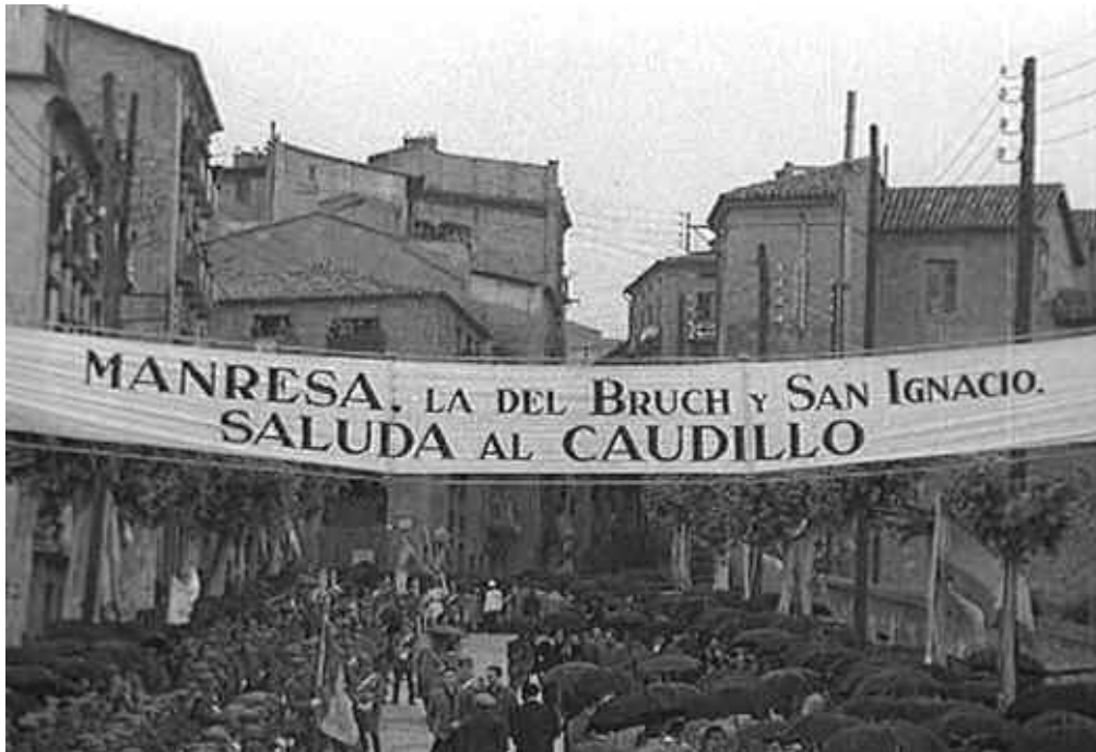
Imatge del documental, procedent de l'arxiu del NO-DO, sobre la primera visita de Franco a Manresa (1947).

Siendo, pues, ya necesario atacar esta corruptela y establecer en el orden de la vida pública el respeto debido a la gloriosa lengua española, que es y debe ser patrimonio común de todos los connacionales, he resuelto disponer lo que sigue: PRIMERO. - A partir del día 1º de agosto próximo, todos los funcionarios interinos de las Corporaciones provinciales y municipales de esta provincia, cualesquiera que sea su categoría, que en acto de servicio, dentro o fuera de los edificios oficiales, se expresen en otro idioma que no sea el oficial del Estado quedarán "ipso facto" destituidos, sin ulterior recurso. SEGUNDO. - Si se tratase de funcionarios de plantilla, titulares o propietarios en tales corporaciones, y se hallaran pendientes de depuración, dicha falta determinará la conclusión del expediente en el estado en que se hallare y la inmediata destitución del transgresor sin ulterior recurso. Si se tratase de funcionarios ya depurados y readmitidos incondicional o condicionalmente, se resolverá en expediente de depuración y