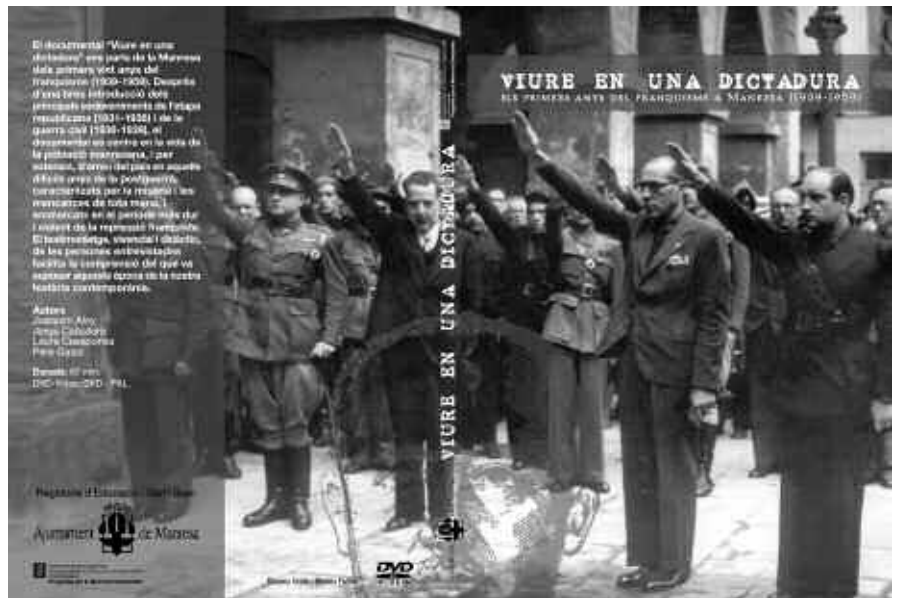
Caràtula del DVD “Viure en una dictadura. Els primers anys del franquisme a Manresa (1939-1959)”, produït per l’Ajuntament de Manresa.