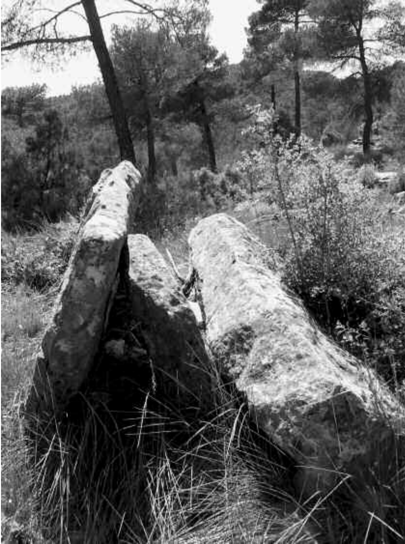
5. L'arca de Boixadors

molt extraordinari que se li hagués donat aquest nom si s'hagués pogut saber en honor de qui s'havia erigit aquest monument. 3 Són topònims antics que més d'una vegada van lligats a la presència de monuments megalítics. Un bon exemple és el del menhir de la Dona Morta de Maçanet de Cabrenys, sobre la ratlla fronterera amb França.