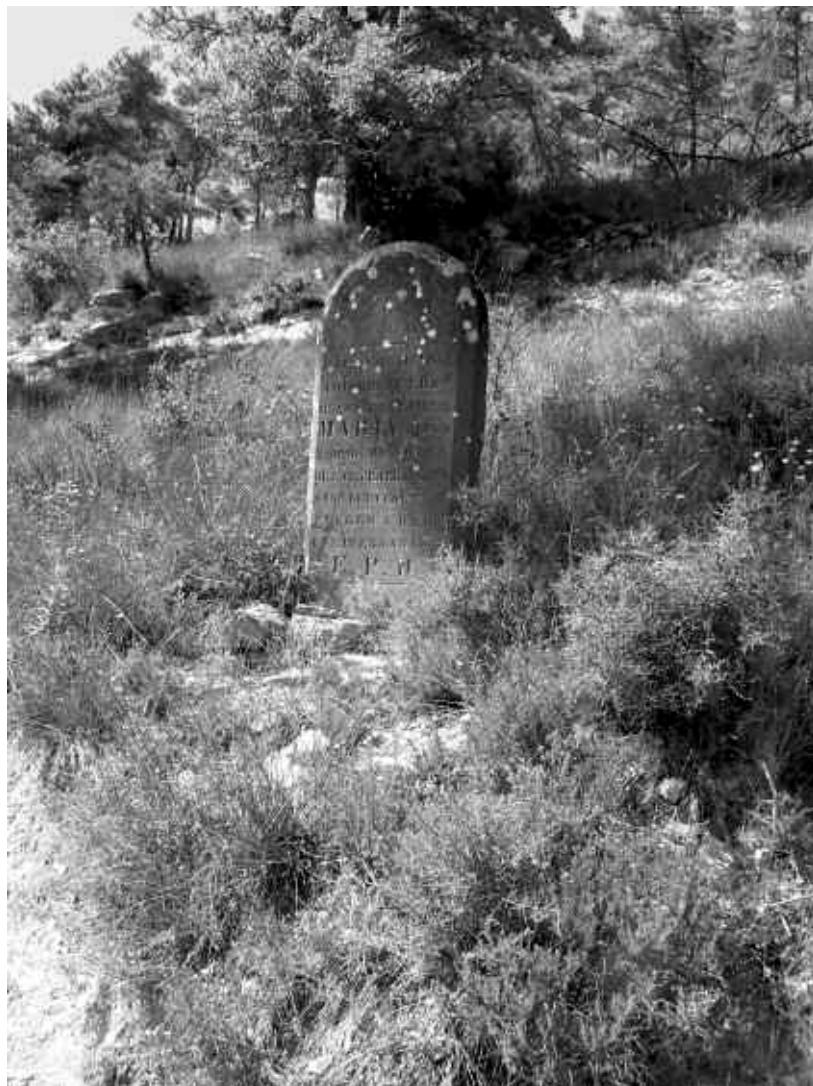
4. Làpida de la Dona Morta

El fet curiós és el següent. L'arca de Boixadors és al vessant sud de la muntanya de Sant Jaume Salerm, no