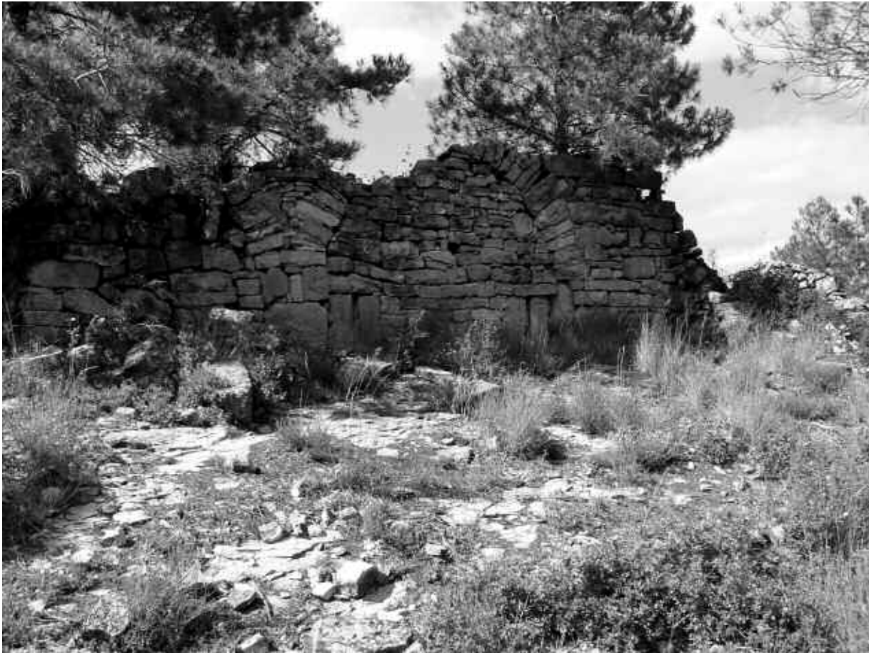
3. Fortí de les Cases de Sant Jaume

punts en què és difícil distingir l'en- derroc de les restes de murs.