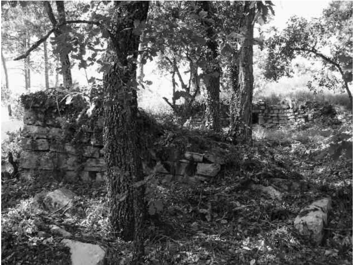
2. Les restes del monestir de Sant Jaume Salerm

aquell lloc hi hagué un monestir de deodats, fenomen que va tenir una àmplia difusió durant el segle XIII. L'única notícia documental que coneixem d'aquest monestir és aquesta, i només podem dir que el text prova l'existència irrefutable del "convent". Segurament no degué tenir mai més de 2 o 3 deodats. Les seves dimensions són poc més que les d'un mas medieval una mica gran. El mateix topònim "Erm" suggereix un tipus de monestir més proper a un eremitori que no pas a un monestir convencional. Tot i amb això, aquestes eren de fet les autèntiques arrels de la vida monàstica, de manera que Sant Jaume Salerm seria un bon exemple d'aquest ideal monàstic. Per altra banda, però, no es troba gaire lluny d'un indret amb molta activitat durant l'edat mitjana. No hem de perdre de vista que el gran castell de Boi-