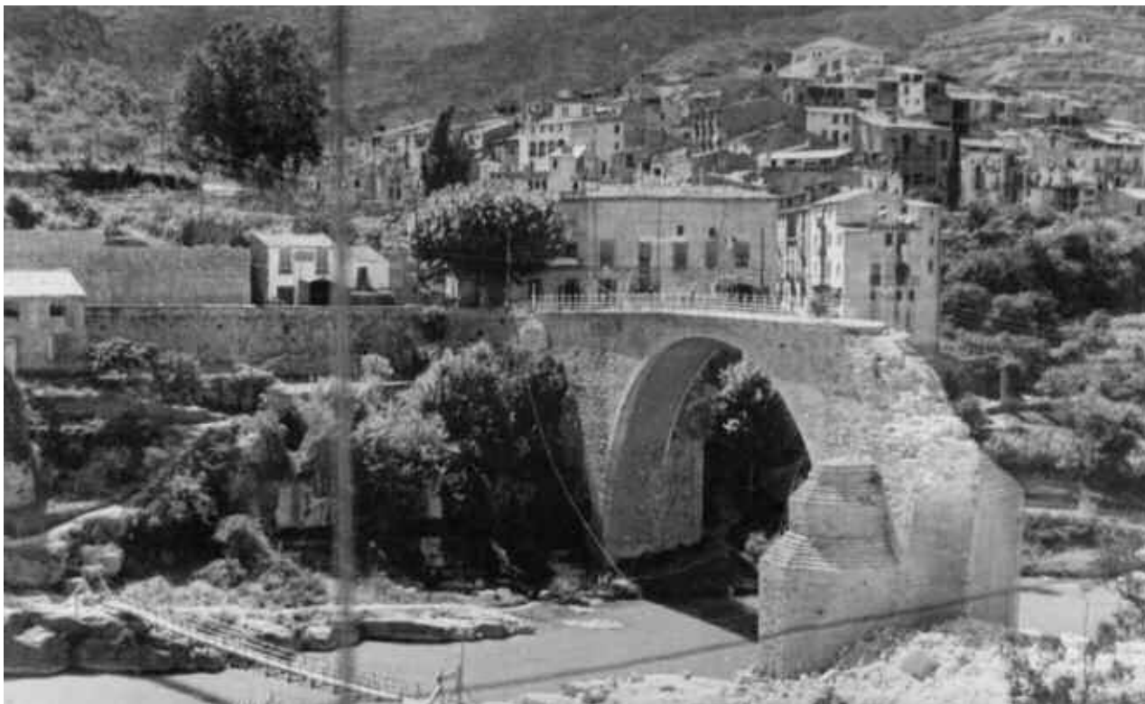
15. Detall del pont dinamitat durant la guerra, i de la passera provisional que hom construí per passar a l'altra costat del poble.

del poble, li serviren un “petit refrigeri”. Durant l'acte, hom realitzà una fotografia on es veu tota la corporació municipal, junt amb el president Macià a la sala de l'Ateneu (Foto 12).