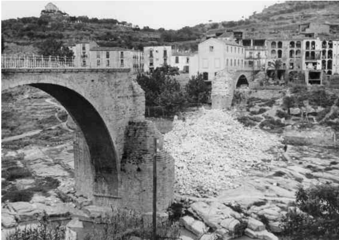
14. El pont de Monistrol volat. Fotografia feta l'11 de juny de 1939.

Cap el 1930 apareixien una sèrie de postals 51 sense indicar-hi l'autor de les imatges. Aquestes vistes duen unes lletres daurades a la postal indicant l'indret retratat 52 . Són unes vistes d'una gran qualitat fotogràfica.