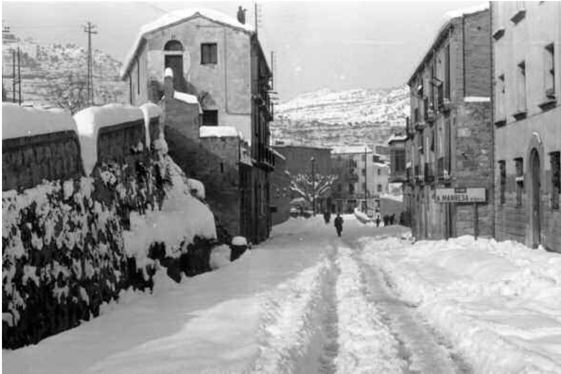
16. Un indret completament desconegut; l'encreuament de la carretera de Monistrol a Montserrat, durant la nevada de 1962.

vers hom estampà "Cliché propiedad de Fotografia "Cuyàs". Rda. S. Pedro, 4.-Barcelona". Els Cuyàs eren una nissaga de fotògrafs establerts a Barcelona el 1899, i que començaren amb el pare; Narcís Cuyàs (1881-1958), i continuat pels seus fills Enric Cuyàs i Prat (1910-1989) i Narcís Cuyàs i Prat (1920-199?). Pel moment, se'n coneixen 6 postals diferents. 75