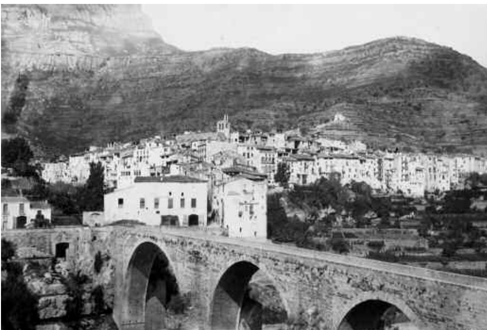
4. El poble de Monistrol, vers 1880. Autor anònim. En aquesta imatge es pot distingir el campanar primitiu, el qual es pot veure en comptades fotografies, ja que el 1907, va ésser remodelat. (Arxiu David Blasco).

A part de les vistes que realitzà el fotògraf Joan Martí el 1875 en l'obra " Bellezas de Montserrat ", anys més tard, vers 1883, impresionava dues vistes; una molt similar a la quina havia fet el fotògraf Mariezcurrena. Aquesta vista, de grans proporcions (26'5 x 21 cm.), on també se'ns mostra la part de la vila. D'aquesta fotografia, s'en féu una còpia en gravat 11 en la publicació " La Ilustración. Revista Hispano-Americana " corresponent al 31 d'agost de 1890. A la portada de l'esmentada publicació, hi ha anotat el següent: "Todos los grabados que publica esta revista son originales ó inéditos en España". També sortí a la publicació religiosa " La Hormiga de Oro ", corresponent al 31 d'agost de 1891. L'altra imatge, de