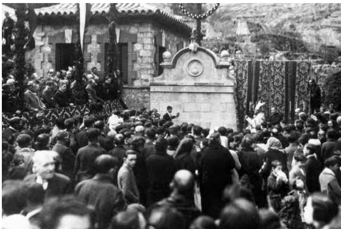
10. Fotografia realitzada per Norbert Bilbeny, amb motiu de la benedicció de la "Font Gran" de Monistrol, per part de l'abat de Montserrat Antoni M a Marcet, el 25 de maig de 1928. (Arxiu Municipal de Monistrol de Montserrat)