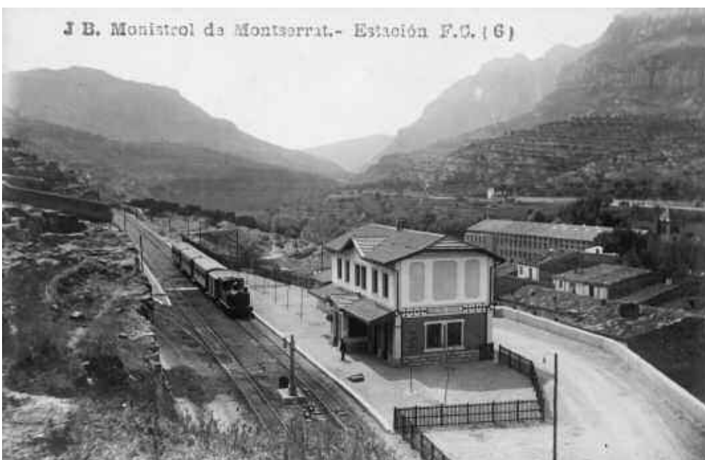
8. Postal feta per Josep Boixaderas vers 1924, on es veu la nova estació dels “catalans”.

El 1896, apareixia un àlbum de fotografies que duia el títol de “Montserrat. 32 fotografias de Audouard 23 ”. Tot just obrint l’àlbum ens trobem amb una fotografia presa des del pont del Cremallera, i al fons es veu Monistrol. El mateix any, ens trobem amb una altra publicació; “Panorama Na-