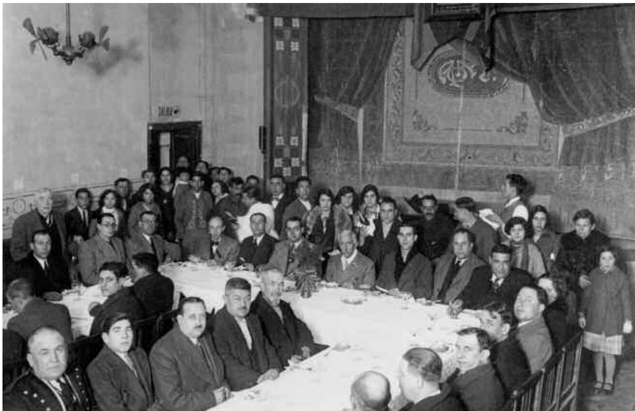
12. Visita del president de la Generalitat, Francesc Macià a Monistrol, el 3 de gener de 1932. Fotografia feta a l'interior de l'Ateneu.

venta una postal 30 , on es veu el poble de Monistrol. D'aquesta postal, almenys hi ha tres "variants"; la feta per L. Roca 31 (tal i com consta al darrera la postal), l'editada per l'"Unió d'antics escolans de Montserrat" i feta amb "Huecograbado" de la casa Mumbrú de Barcelona 32 , i una darrera també editada per l'"Unió d'escolans de Montserrat", però acolorida per "Teodor Eismann" a Leipzig 33 .