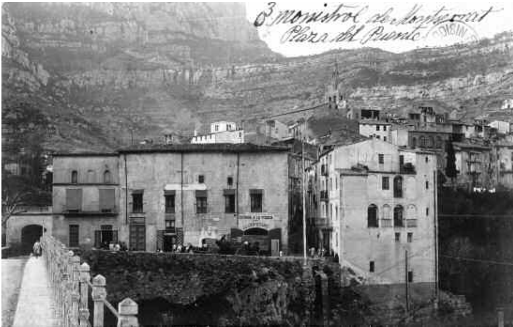
7. Prova de postal, amb anotació manuscrita de Lluçia Roisin, feta vers 1920-25.

desde Monistrol. J. E. Puig. Fotº. Escudillers, 89. Barcelona” 19 (foto 5).