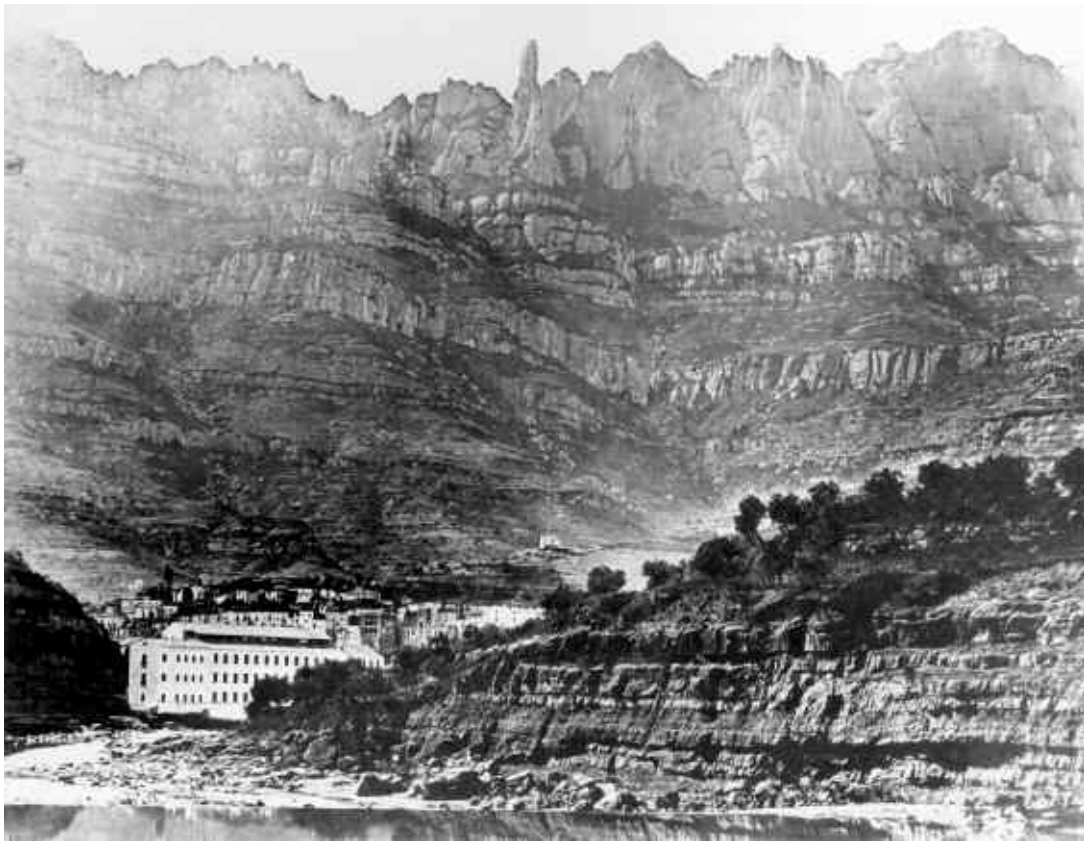
1. Fotografia realitzada pel fotògraf anglès Charles Clifford el 30 de setembre de 1860 (Fons: Biblioteca del Palacio Real, Madrid, i Biblioteca de Montserrat)

Al llarg dels segles, els pelegrins que anaven a Montserrat, optaven més per pujar per Collbató que no pas per Monistrol; el camí era més còmode, i per aquest motiu, tots els gravats se'ns mostra l'accés al monestir per la part del poble de Collbató.