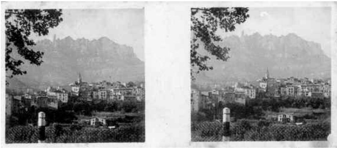
13. Vista estereoscòpica, feta vers 1935, per "Galletas y Chocolates Solsona-Rius S. A.", per a ésser enganxada en un àlbum que tenia per nom "España y sus bellezas". Encara s'observa el campanar que fou destruït durant la guerra civil.

ràmica sobre el pueblo de Monistrol", un "Efecto de luz cerca Monistrol-Villa", i una de "Monistrol a vista d'au-cel·les desde el Cremallera" 41 . En una postal, al darrera hi ha anotat: "Tiraje: A. Zerkowitz. Distribuidora: Pablo Dümmtzen. Barcelona", i en una altra "I/144-Montserrat. Vista de Monistrol. Fot. Zerkowitz". Al darrera només hi ha anotat "Tarjeta Postal". El 1919 realitza una fotografia de l'antic rentador públic situat prop de la plaça de la Font Gran, i cap als inicis de 1929 reproduceix una vista de Monistrol amb la muntanya de Montserrat al fons 42 en una sèrie de segells "Montserrat i Nuria". També sorti en postal amb el títol "Montserrat 2 La montaña y Monistrol. La muntanya i Monistrol". Al darrera hi ha imprès: "Talleres A. Zerkowitz, Fotografo - Barcelona". També hi ha una postal que a sota de la imatge del poble hi posa: "Montserrat: Vista general de Monistrol", i al darrera hi ha imprès: "Ediciones Adolfo Zerkowitz, Fotografo-Barcelona. Huecograbado Mumburú". Aquesta postal igualment cal datar-la vers 1930.