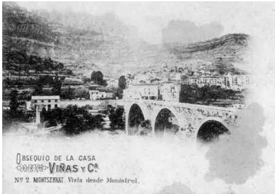
5. Una de les primeres postals de Monistrol, fetes vers 1900, a partir d'una fotografia de Josep Esplugas Puig.