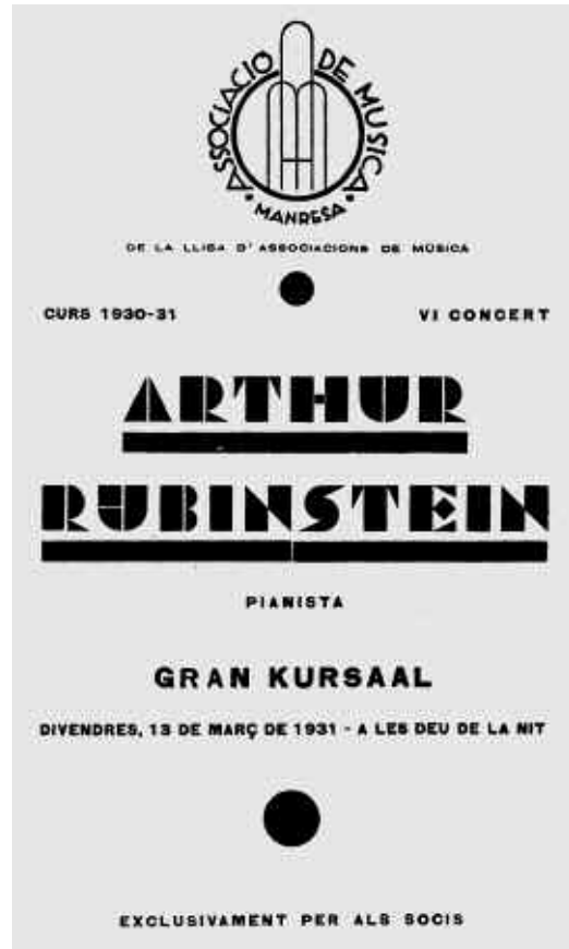
Cartell del concert de l'any 1931

d'el·logi, quant els músics més eminents l'anomenen el «geni» de la música. Nosaltres, repetim, el qualifiquem, amb ple convenciment «el perfecte cavaller del piano».