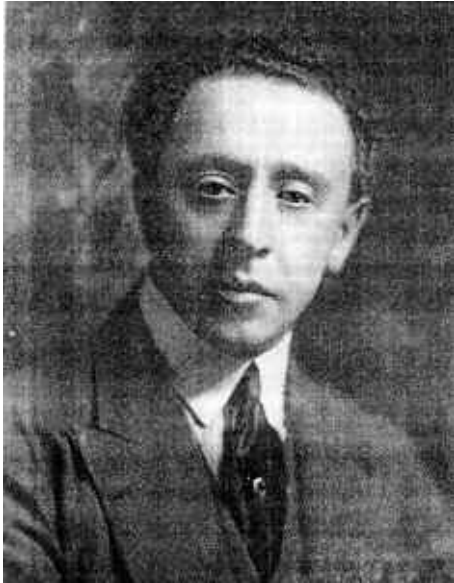
Fotografia d'Arthur Rubinstein en el cartell de l'any 1931