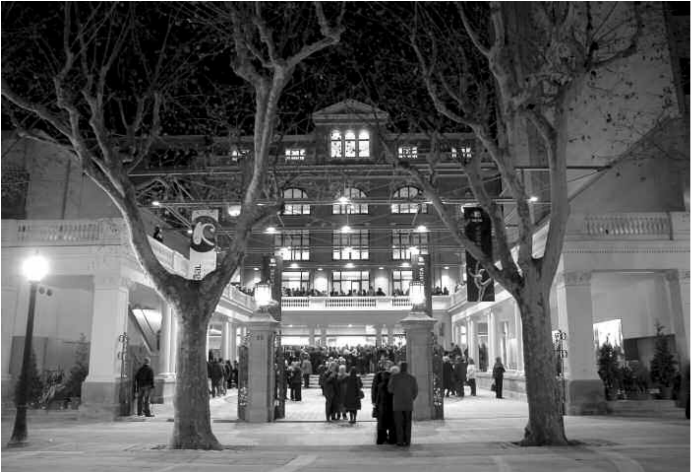
El Kursaal, avui dia.

També Vicenç Prat 22 recorda el fet: un ratoli va tenir la sorprenent originalitat de passejar-se per la barana del segon pis; va resseguir tota la gran ferradura felpada del teatre i s'entornà al seu forat. Diuen que ningú no va fer el més lleu gest ni soroll i que el concertista no va donar-se compte de res. Després, assabentat, proclamà que enlloc del món s'hauria vist un cas col·lectiu de semblant capteniment.