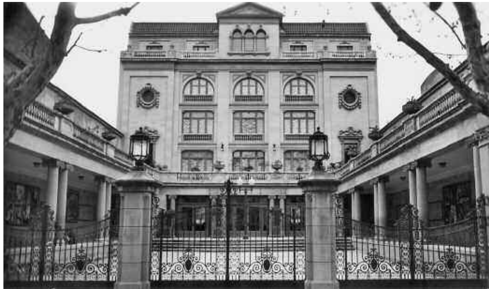
Teatre Gran Kursaal l'any 1952.

L'organitzadora d'aquests concerts fou l'Associació de Música de Manresa 1 , que es va fundar el 22 de gener de l'any 1930. L'objecte de l'Associació serà fomentar i propagar el divi Art dels sons , i amb aquest ob-