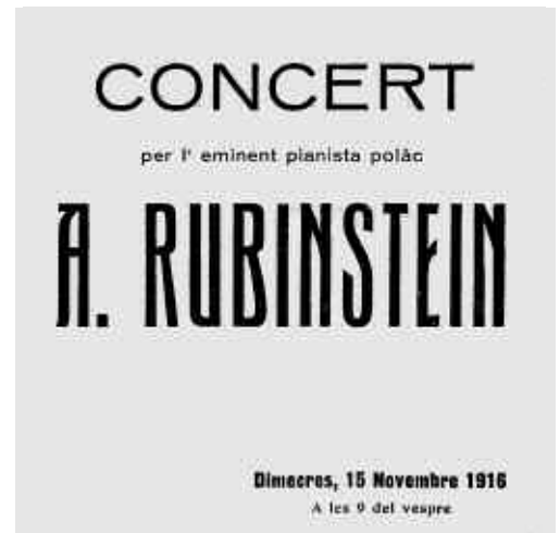
Cartell del concert de l'any 1916

El programa que va escollir Rubinstein en la seva actuació al teatre Kursaal va ser: Toccatà d'orgue en Do: Prelude, Adagio, Intermezzo i Fu-