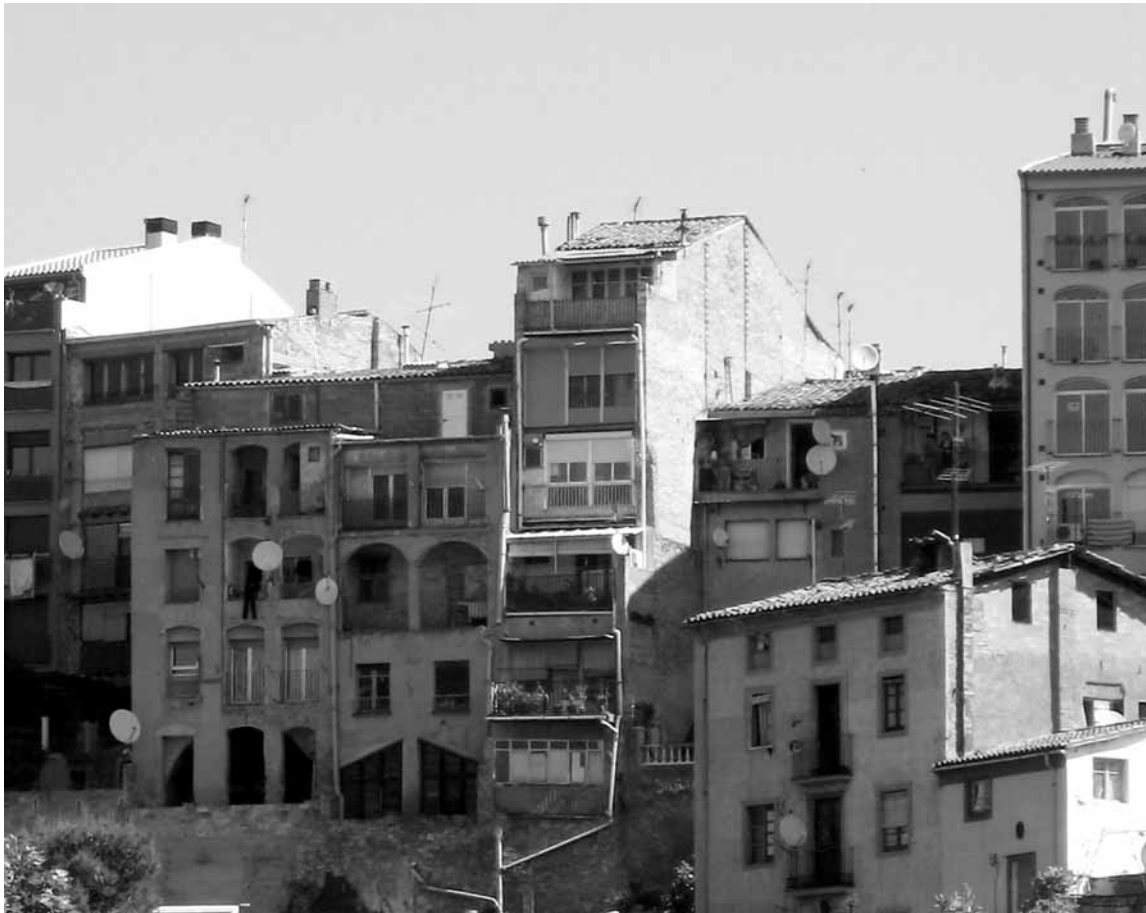
Vista per la banda del darrere de les cases del carrer Sant Bartomeu, a les Escodines

jectius necessaris per aconseguir un Nucli Antic interessant.