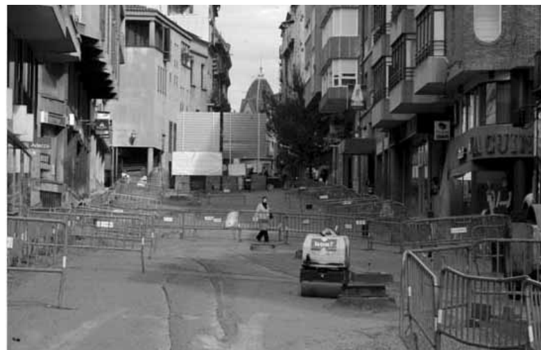
Obres al carrer d'Alfons XII

El problema que hi veig és que la gestió urbanística necessària per poder fer aquestes actuacions és massa lenta i passaran bastants anys per poder assolir els ob-