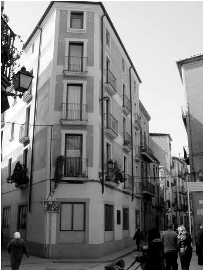
Carrer Sant Francesc, crúïlla Barreres

Estem a les acaballes de l'any 2008. Fins aquí Manresa ha rebut aquest suport molt important que ha ajudat a millorar el Barri Antic. La imatge que es veu es ben diferent de la de fa deu anys. S'han fet obres molt importants i en alguns casos els promotors han contribuït a rehabili-