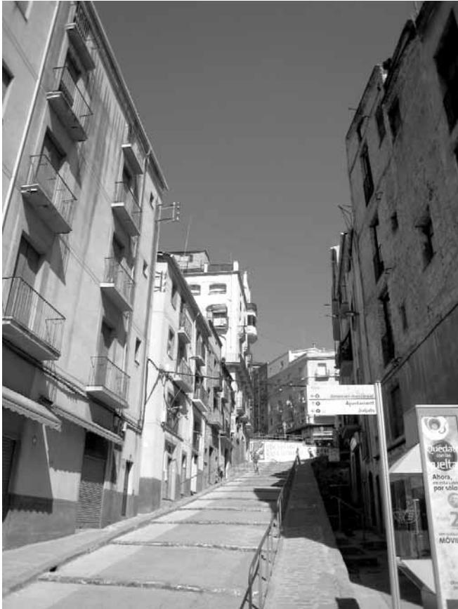
Baixada dels Drets

alguna de les grans places o obrir els espais de lleure de les escoles.