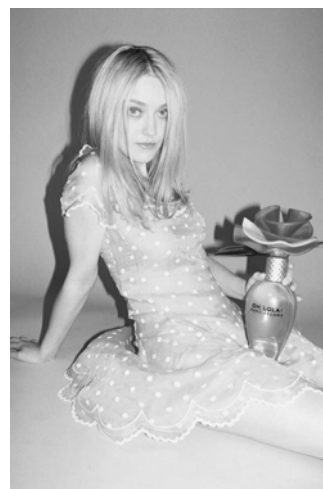
Fig. 3. Oh Lola