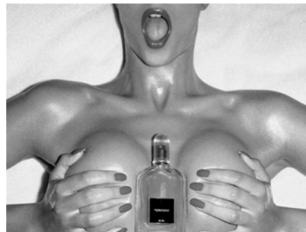
Fig.7. Tom Ford for men