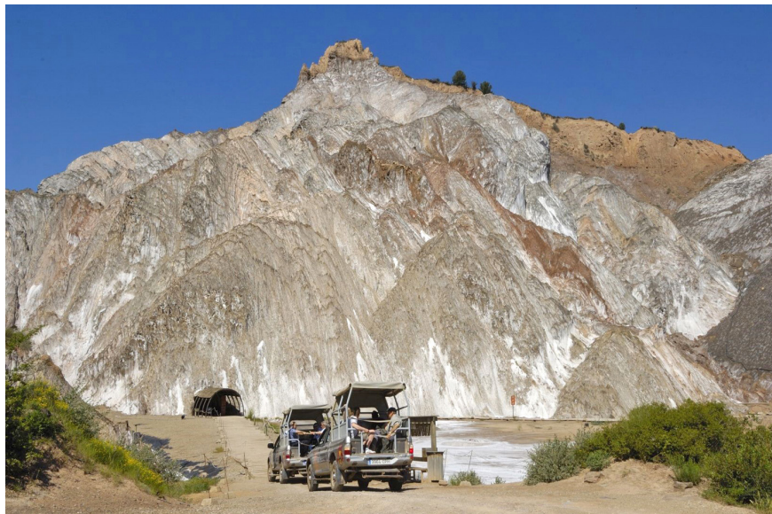
Figura 5. Parque Cultural de la Montaña de Sal de Cardona