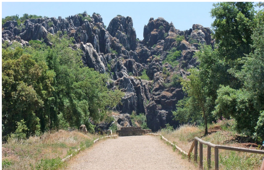
Figura 4. Cerro del Hierro