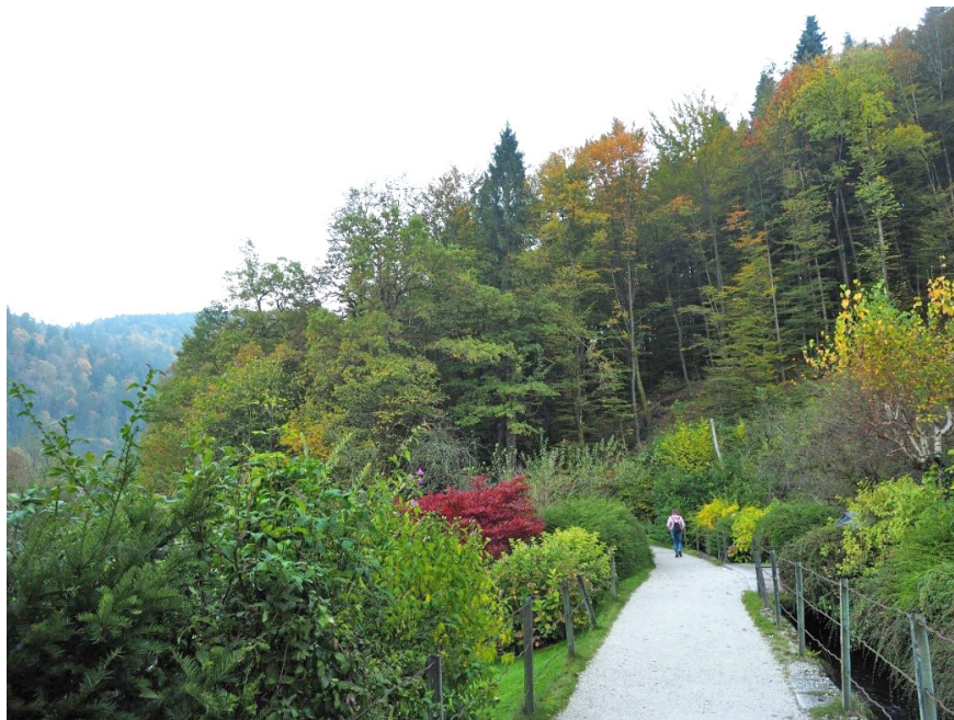
Figura 1. Sendero y canalizaciones hidráulicas mineras en el geoparque de Idrija (Eslovenia)