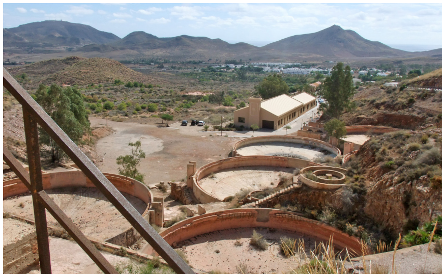
Figura 3. Lavaderos de mineral y La Casa de los Volcanes