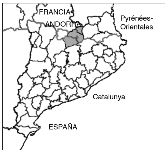
Figura 2. Área de atención del Hospital de la Cerdaña.