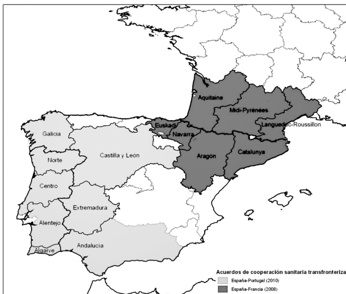
Figura 1. Área de aplicación de los acuerdos de cooperación sanitaria transfronteriza en España.

En lo que concierne más específicamente a la cooperación sanitaria transfronteriza, y siguiendo el modelo aplicado en otros estados, se han firmado el Acuerdo Marco entre Francia y España sobre Cooperación Sanitaria Transfronteriza (2008) y el Acuerdo Marco entre España y Portugal sobre Cooperación Sanitaria Transfronteriza (2010), de aplicación en las respectivas regiones (NUTS 2) fronterizas (figura 1). Ambos se acompañan de acuerdos administrativos relativos a las modalidades de aplicación, que precisan el marco jurídico en el que se inscribe la cooperación sanitaria transfronteriza, con el fin de asegurar una mejor atención a la población fronteriza, optimizar la oferta